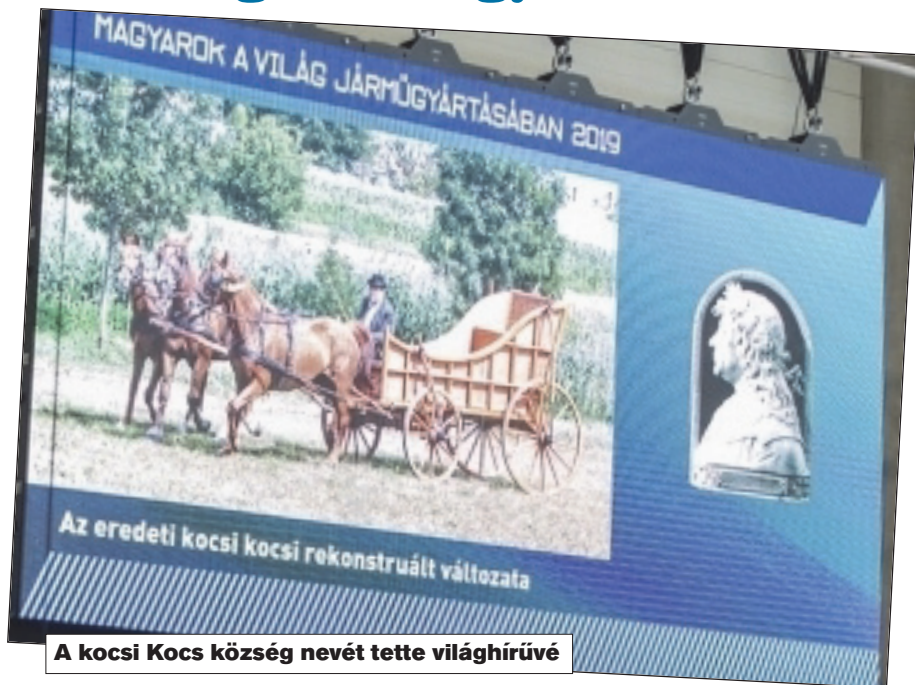
A kocsi Kocs község nevét tette világhírűvé