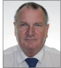
A Lámpafelelős Főtaxi URH 558