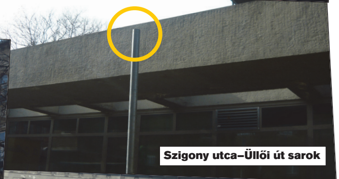
Szigony utca-Üllői út sarok