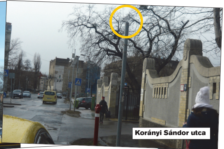
Korányi Sándor utca