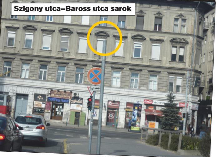
Szigony utca-Baross utca sarok

Taxis kollégák döbbenettel jelezték, hogy Óbuda – Békásmegyer – Csillaghegy után a Józsefvárosból is egymás után tűntek el a TAXIÁLLOMÁS jelzőtáblák! Talán színesfémgyűjtők szedték őket össze?