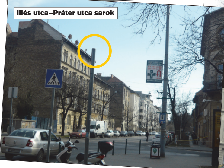
Illés utca-Práter utca sarok