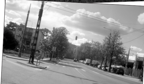
Lefelé hosszú egyenes a szakasz a Budakeszi úton, gyakori a gyorsajtó