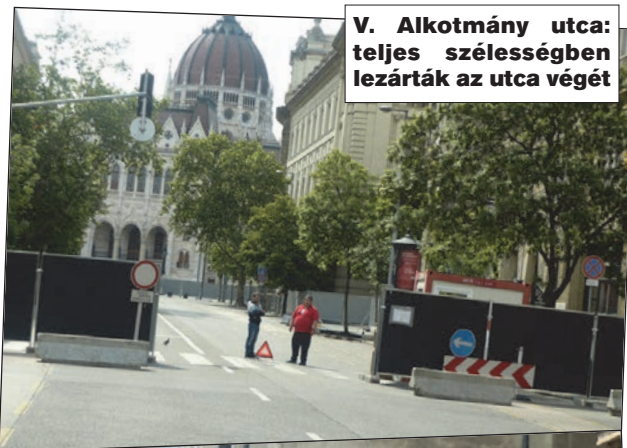
V. Alkotmány utca: teljes szélességben lezárták az utca végét