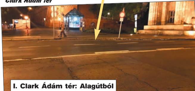
I. Clark Ádám tér: Alagútból kijövet balra lehet fordulni

Taxis kolléga vette észre, hogy terelővonalakat festettek a záróvonal mellé, így most elvileg, ha kijöttünk az Alagútból, közvetlenül fel lehet kanyarodni a Hunyadi János utca felé. Megkérdezzük majd a közlekedésszervezőket, mi volt a szándékuk az új útburkolati jelek felfestésével. Egyes információk szerint a turistabuszoknak akartak kedvezni, hogy ne kelljen elmenni a körforgalomig, hanem közvetlenül felhajthassanak a Várba.