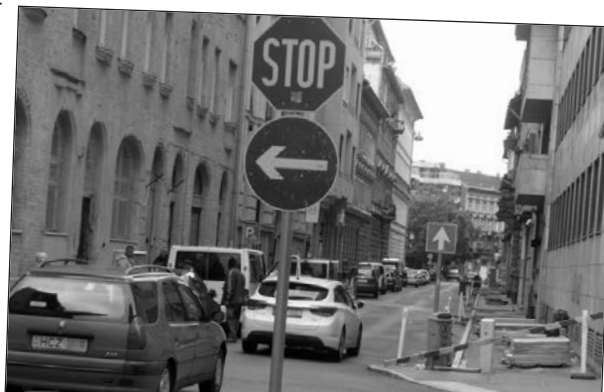
Elméletileg tilos az egyenes továbbhaladás, de a gyakorlatban senkit sem zavarnának

hetekkel kint voltak a „harmincas” táblák. Ez érthető is volt, mert az út felület egyik felét aszfaltolták, a másik felén haladt az autóforgalom. Utána cserélődött a helyszín, az egyik felén haladt a forgalom, a másik felét aszfaltolták. Csakhogy már régen elkészült