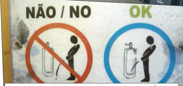
Illemrend az illemhelyen. Van ami helyes, és van, ami nem...