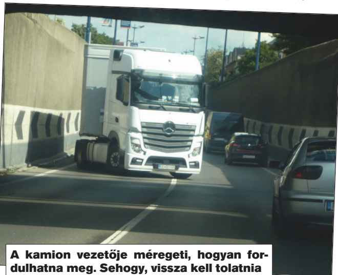
A kamion vezetője méregeti, hogyan fordulhatna meg. Sehogy, vissza kell tolatnia

Most egy újabb korosztály, a mai, dúdolhat egy másik dalt a „Szomorú péntek”-ről. Ugyan-