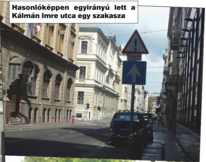
Hasonlóképpen egyirányú lett a Kálmán Imre utca egy szakasza