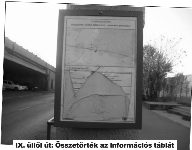
IX. üllői út: Összetörték az információs táblát

Összetörték az információs táblát, kérjük kicserélni. Az információs tábla kicserélése megtörtént.