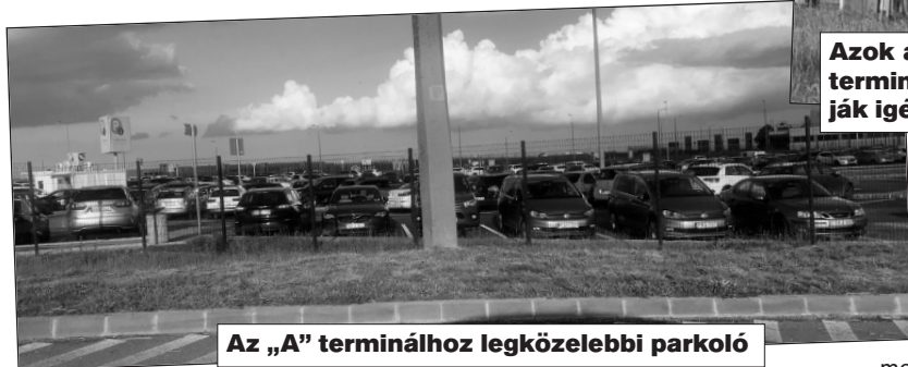
Az „A” terminálhoz legközelebbi parkoló

Egy új biztonsági szolgálat végzi a rend fenntartását, szoros együttműködésben a repülőtéri rendőrséggel. A terminálok kordonnal jelölték ki azt a területet, ahol az érkező utasokra várhatnak rokonok, barátok, illetve a mi esetünkben olyan taxisok, akik (névre, vagy cégre szóló) táblával várják a partnereiket.