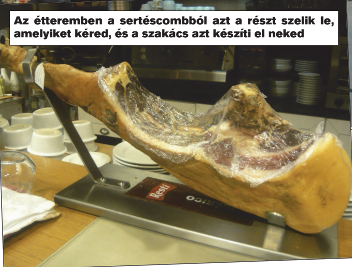
Az étteremben a sertéscsontból azt a részt szelik le, amelyiket kéred, és a szakács azt készíti el neked

Az öreg paraszt kinn szánt a falu határában. Oda-megy hozzá a szomszédja: