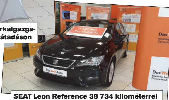
SEAT Leon Reference 38 734 kilométerrel

méteradatokkal hoznak be lepusztult autókat, melyeket kicsit „feljavítva” rásóznak valakire, aki elhiszi a jól előadott mesét az autóról. Aztán – az esetek egy részében – kiderül, hogy a kilométeradatok manipuláltak, vagy az autót már akár totálkárossá nyilvánították, esetleg ikresítették. Az sem kizárt, hogy valahol lopták és körözik. Vagy egyszerűen széthajtották. Ekkor persze az is kiderül, hogy az „üzle-