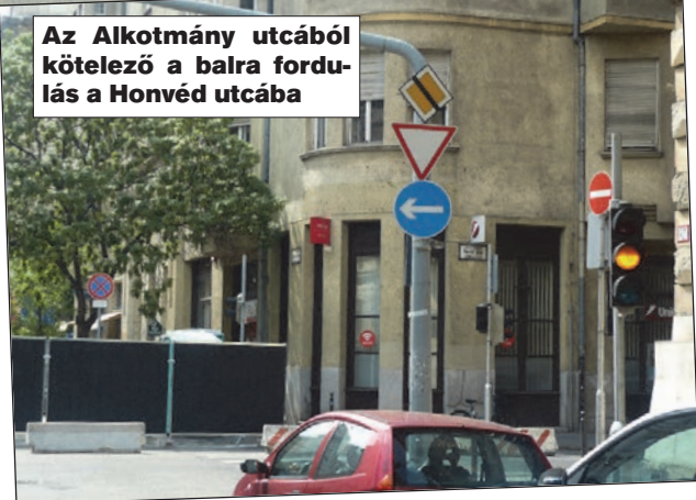
Az Alkotmány utcából kötelező a balra fordulás a Honvéd utcába

Az elmúlt időszak legjelentősebb forgalmirend-változása történt a Belvárosban. Teljes szélességben lezárták az Alkotmány utcát a Honvéd utca és a Kossuth tér között. Ezzel egy időben a környező utcákban is jelentős változások történtek. Kétirányú lett a Szalay utca a Honvéd utca és a Falk Miksa utca (Kossuth