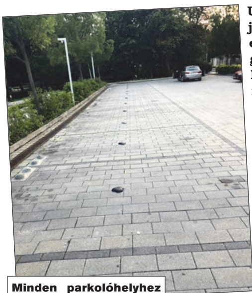
Minden parkolóhelyhez egy szenzor kerül

A Főváros által kijelölt, engedéllyel rendelkező személyszállító cégek gépjárművei (sárga taxik), az éves engedély kiváltásakor egy összegben, előre kötelesek megfizetni a Budapesten kijelölt taxidrosztok használati díját.