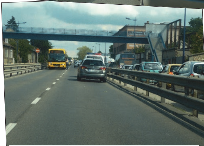
Ugyanabban az időben egy lerobbant autó kifelé, a beton felé. Ha nem lenne korlát, egy perc alatt kitolhatták volna. A BKK ellenőr egy Volánbuszt próbál megállítani, hiszen tovább menni úgysem tud