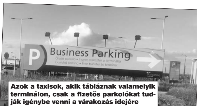
Azok a taxisok, akik tábláznak valamelyik terminálon, csak a fizetős parkolókat tudják igénybe venni a várakozás idejére

A parkolók használata annyiban változott, hogy a fővárosi