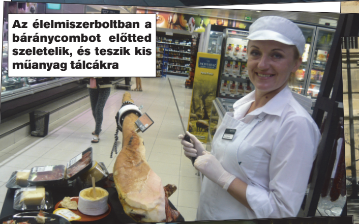
Az élelmiszerboltban a báránycsontot előtted szeletelik, és teszik kis műanyag tálcákra

A porugál rendszám-tábla is igazolja, 2019. 03. hónapban, az Atlanti-óceán partjainál lettem nyugdíjas