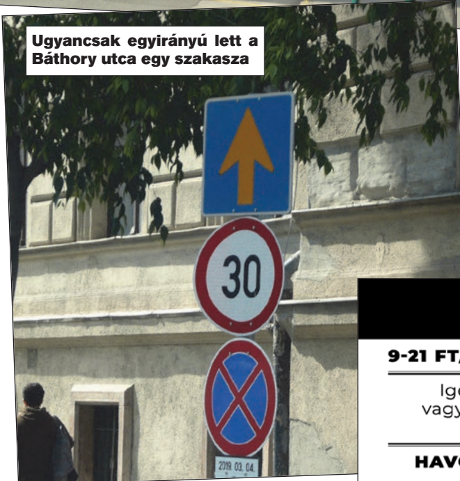
Ugyancsak egyirányú lett a Báthory utca egy szakasza