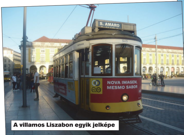
A villamos Liszabon egyik jelképe