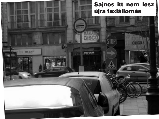
V. Semmelweis utca: Sajnos itt nem lesz újra taxiállomás

Jeleztük, hogy az utca átépítésekor „elfelejtették” visszahelyezni a taxiállomást. Megígérték, de miután nem tették meg, ismét kérjük.