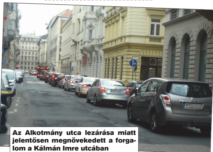
Az Alkotmány utca lezárása miatt jelentősen megnövekedett a forgalom a Kálmán Imre utcában

Az emlékezetes tragikus halálos baleset után a közlekedésszervezők ígéretet tettek a forgalmirend-változtatásra. Az új forgalmi rendben a „tele zöldes” irányítás helyett a Dózsa György úton külön fázisban kapnak szabad jelzést az egyenesen haladók és a balra kanyarodók. A Kassák Lajos út felől érkeve maradt a korábbi „tele zöldes” forgalomirányítás.