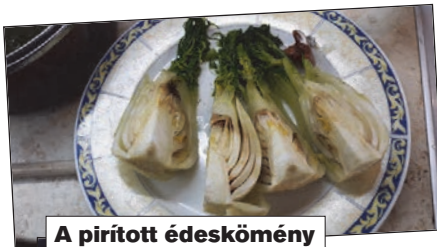
A pirított édeskömény

Midőn eljövén a sütésnek ideje, magas hőfokon minden oldalról át-