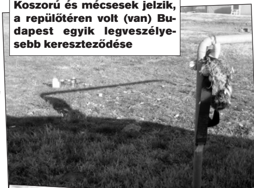
Koszorú és mécsesek jelzik, a repülőtéren volt (van) Budapest egyik legveszélyesebb kereszteződése