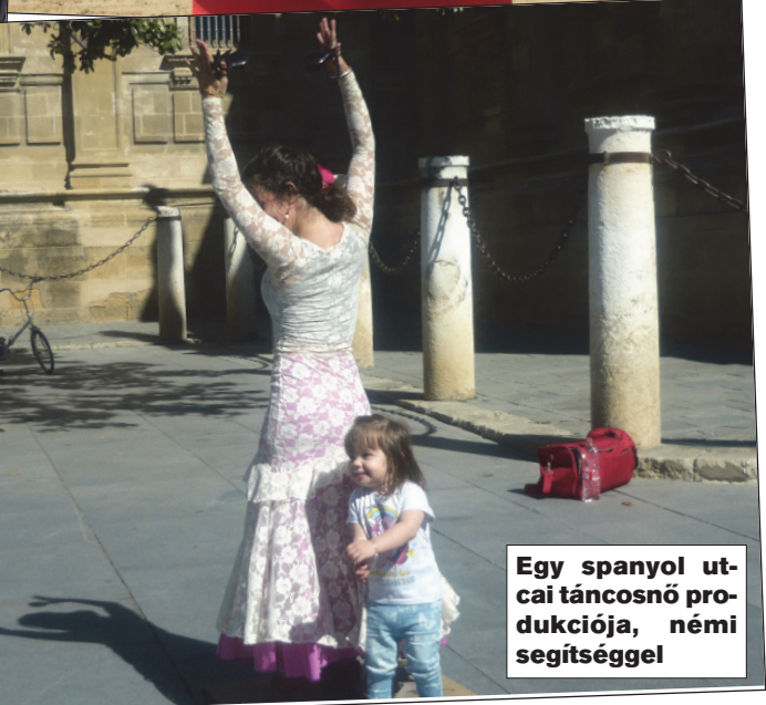
Egy spanyol utcai táncosnő produkciója, némi segítséggel