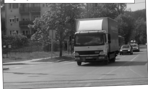
A Zugligeti útra kanyarodók nem mindig látják a buszsávon érkezőket