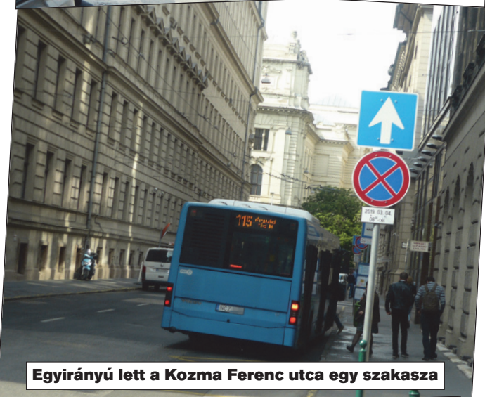
Egyirányú lett a Kozma Ferenc utca egy szakasza