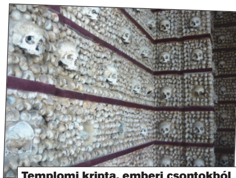
Templomi kriptá, emberi csontokból

14. Helyes a „B” válasz. A terelő- és a záróvonallal mellett még két, az út vonalvezetésével párhuzamos vonalat ismer a KRESZ: az úttest szélét jelző- és a kerékpársávot kijelölő vonalat. A kerékpársávot, az autóbusszöblöt, az autóbussz forgalmi sávot, valamint a gyorsító- és lassító sávot azonban a párhuzamos közlekedés szempontjából figyelmen kívül kell hagyni.