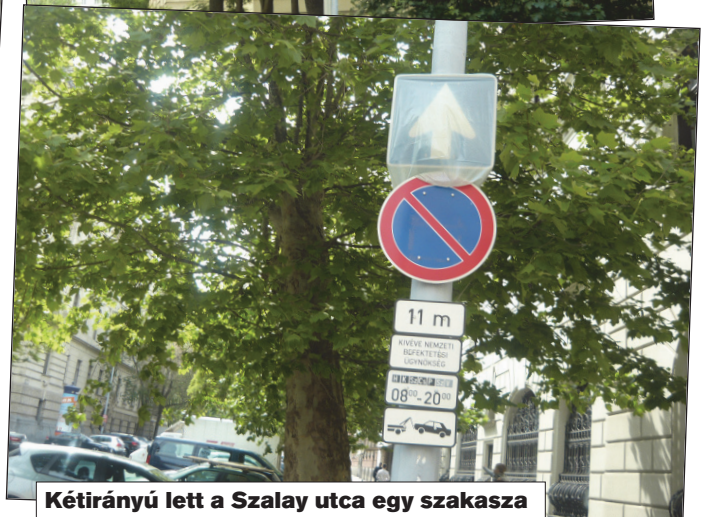
Kétirányú lett a Szalay utca egy szakasza