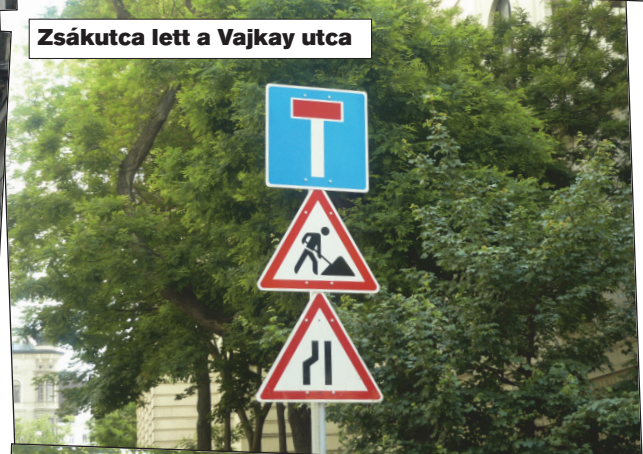
Zsákutca lett a Vajkay utca