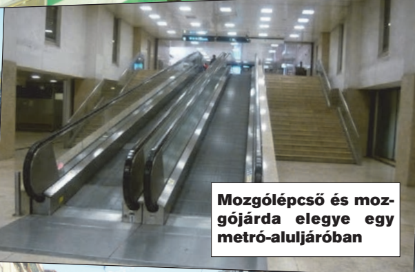
Mozgólépcső és mozgójárda elegye egy metró-aluljáróban