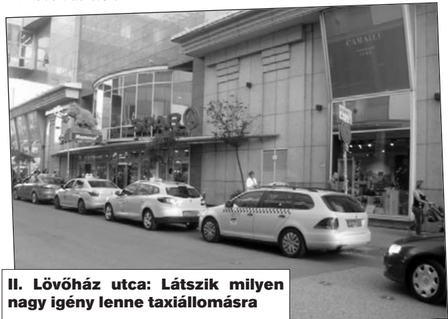
II. Lövőház utca: Látszik milyen nagy igény lenne taxiállomásra

A budapesti taxisok évek óta kérnek taxiállomást Buda egyik legnagyobb bevásárlóközpontja és piaca közelébe. Hivatalos taxiállomás itt nincs, de sok taxit rendelnek ide.