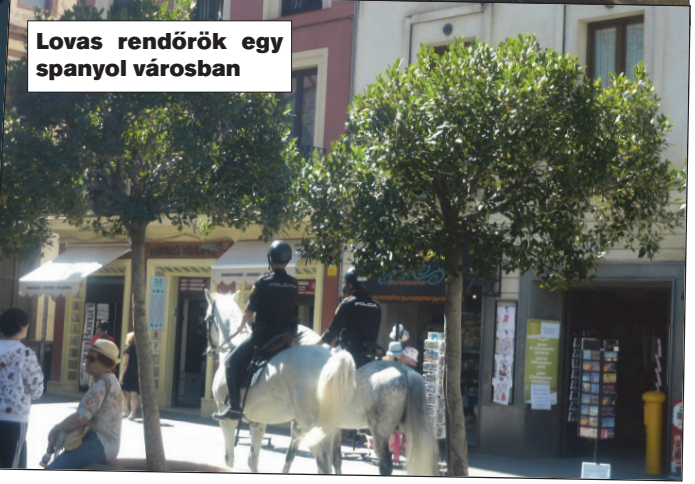
Lovas rendőrök egy spanyol városban