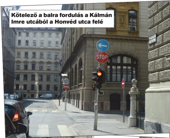
Kötelező a balra fordulás a Kálmán Imre utcából a Honvéd utca felé