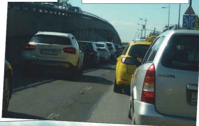
Természetesen a Gyorsforgalmival párhuzamos utak egy perc alatt bedugultak