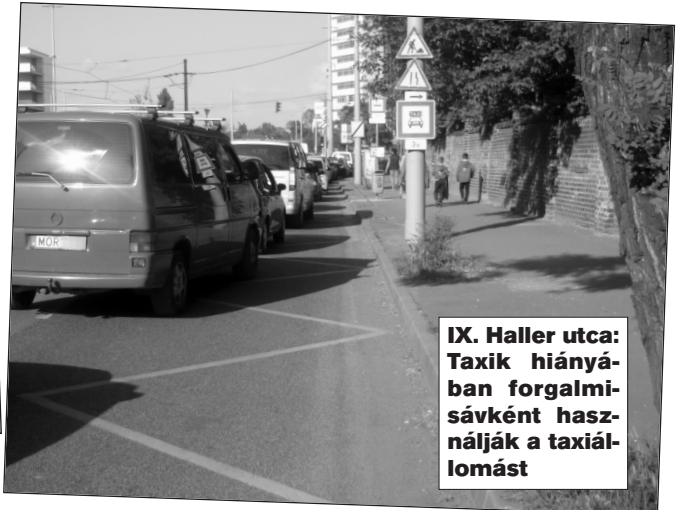
IX. Haller utca: Taxik hiányában forgalmisávként használják a taxiállomást

A legújabb taxiállomást a Nagyvárad tér közelében alakították ki. Célszerű lenne igénybe venni. „Beülős” utasra kicsi az esély, de a műholdak segítségével jól elérhetőek a külső-józsefvárosi és a külső-ferencvárosi telefonos rendelések.