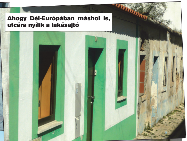
Ahogy Dél-Európában máshol is, utcára nyílik a lakásajtó