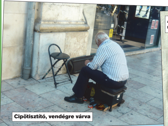
Cipőtisztító, vendégre várva