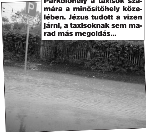
Parkolóhely a taxisok számára a minősítőhely közelében. Jézus tudott a vizen járni, a taxisoknak sem marad más megoldás...