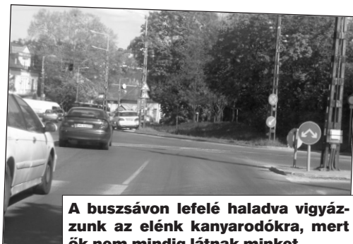
A buszsávon lefelé haladva vigyázzunk az elénk kanyarodókra, mert ők nem mindig látnak minket

Baj itt is akkor van, ha közben a külső sávban nagy sebességgel érkezik jármű. Hogyan előzhetjük meg a baleseteket ebben a kereszteződésben? Egy profi járművezetőnek, egy taxisnak nem okoz gondot a mellékútról besorolni egy négysávú útra. A