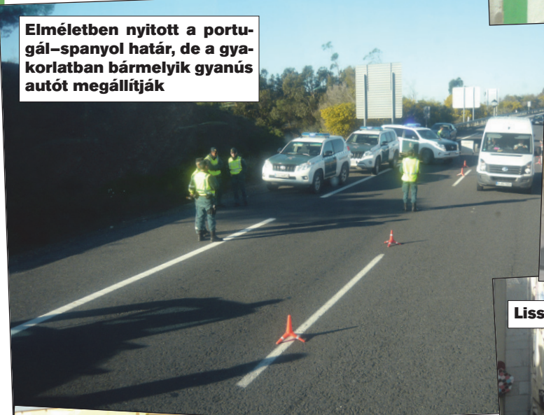
Elméletben nyitott a portugál-spanyol határ, de a gyakorlatban bármelyik gyanús autót megállítják