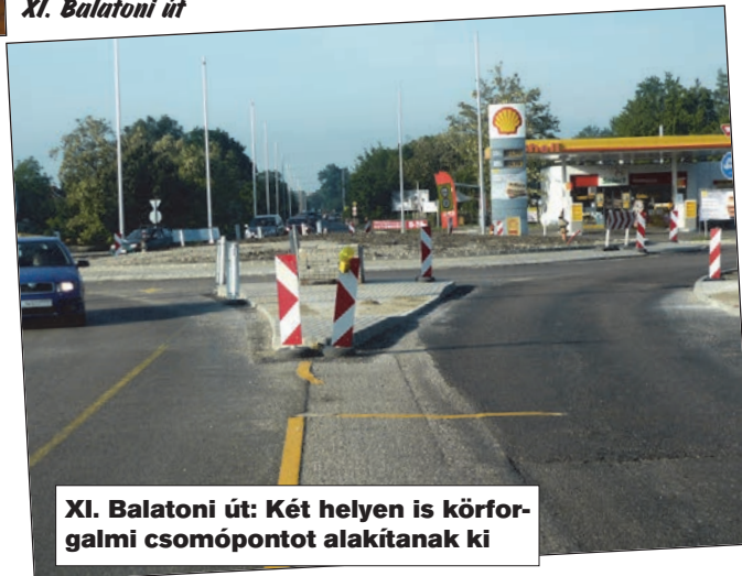
XI. Balatoni út: Két helyen is körforgalmi csomópontot alakítanak ki

A biztonságosabb és folyamatosabb közlekedés érdekében két helyen is körforgalmi csomópontot alakítanak ki. A Tanító utcánál már majdnem teljesen kész az új körforgalom, a Háros utcánál még a földmunkáknál tartanak.