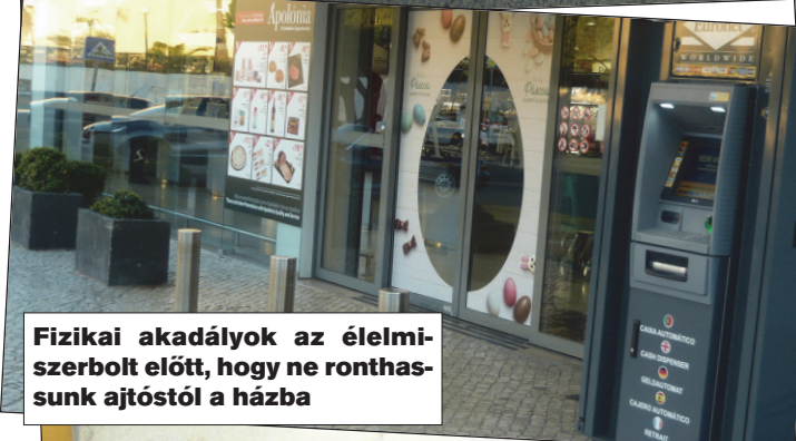
Fizikai akadályok az élelmiszerbolt előtt, hogy ne ronthatssunk ajtóستól a házba