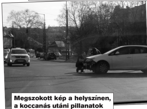
Megszokott kép a helyszínen, a koccanás utáni pillanatok

Budakeszi útról balra kanyarodásnál pedig figyeljünk arra, hogy a buszsávon lefelé nem jön-e „ezerrel” jármű. Ha a buszsávon jövünk lefelé, akkor figyeljünk arra, hogy nem fordulnak-e elénk szabálytalanul.