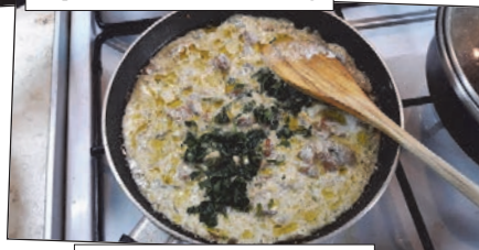
Készül a gombaszós

sütöttem, kergesítettem, majd felöntöttem vörösborral, kapott némi gyömbért, s így pároltam puhára a combot.