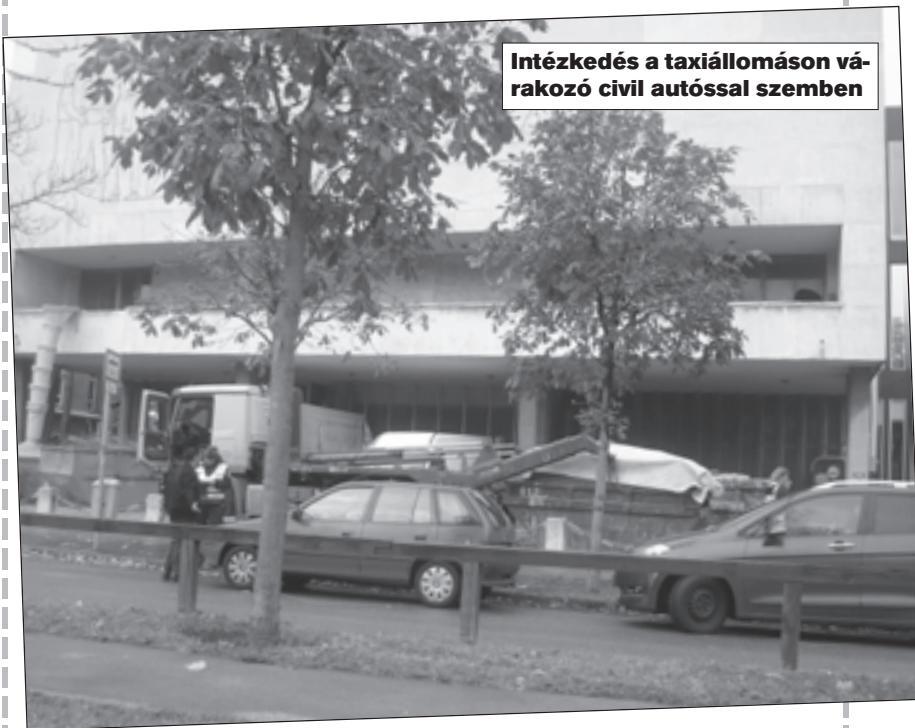
Intézkedés a taxiállomáson várakozó civil autóval szemben