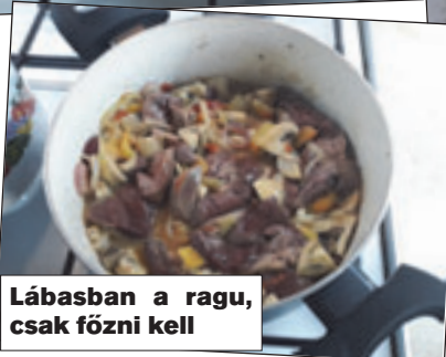
Lábasban a ragu, csak főzni kell