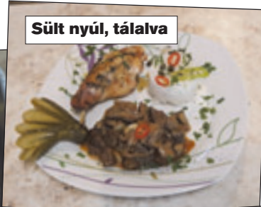
Sült nyúl, tálalva