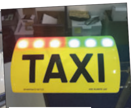
Folytatás a 35. oldalról

debb utazások – városon belül – kb 600 forintnak megfelelő euróba kerülnek, de a hosszabb utakért 800 forintnyi eurót is elkér