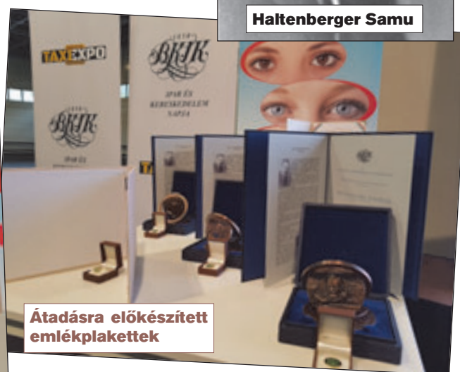
Átadásra előkészített emléklapok