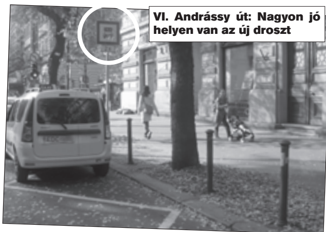
VI. Andrásy út: Nagyon jó helyen van az új droszt

Nagyon jó helyen, a Nagymező utca előtt, a színházak közelében van az új taxiállomás. Örömmel látni, hogy a budapesti taxisok máris birtokba vették.