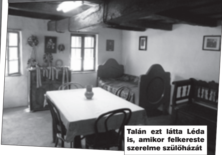
Talán ezt látta Léda is, amikor felkereste szerelme szülőházát

Amíg a Kerepesi temetőben a szigetként komoran magában álló Ady-szobrot föl nem állították, eredetileg ott elevenzöld, egy kicsiny parcella-sziget volt. Lombok, bokrok, zöld pázsit közepén állt a költő örökzölddel befuttatott sírhalma. A sír fejénél szép mivesen faragott, csúcsos hegyű debreceni fejfa állt – ahogy Ő kérte. De ugyan hallgat-e ily szelíd kívánságra a hálás utókor?