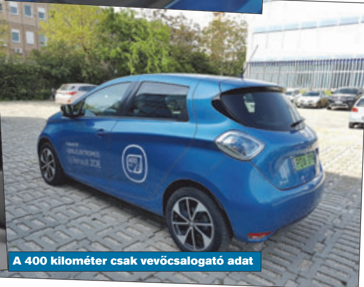
A 400 kilométer csak vevőcsalagató adat

– A francba, ember, a szívbajt hozta rám! Mit csinál itt maga az éjszaka közepén? – Elírták a nevemet, azt javítom.