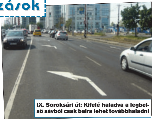
IX. Soroksári út: Kifelé haladva a legbelső sávból csak balra lehet továbbhaladni