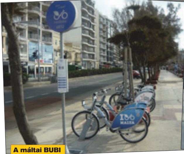
A máltai BUBI