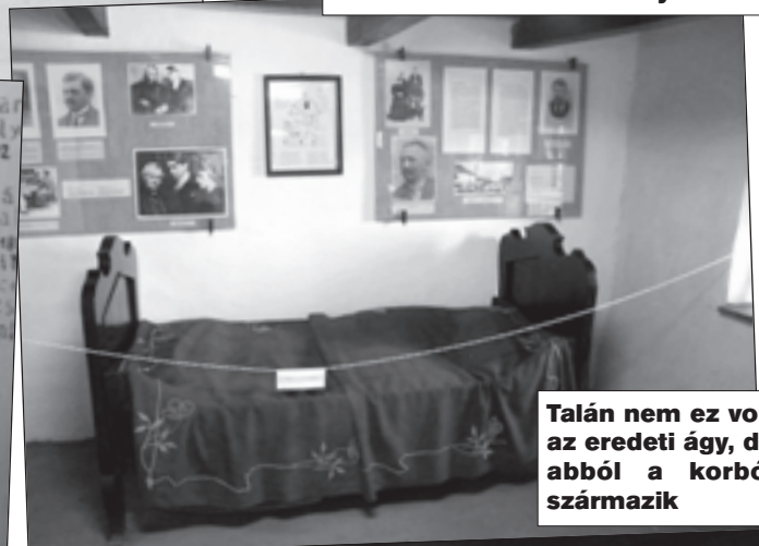
Talán nem ez volt az eredeti ágy, de abból a korból származik