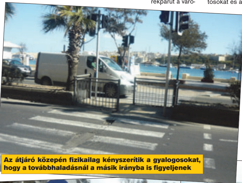
Az átjáró közepén fizikailag kényszerítik a gyalogosokat, hogy a továbbhaladásnál a másik irányba is figyeljenek

Persze az integetés sem jelent garanciát arra,