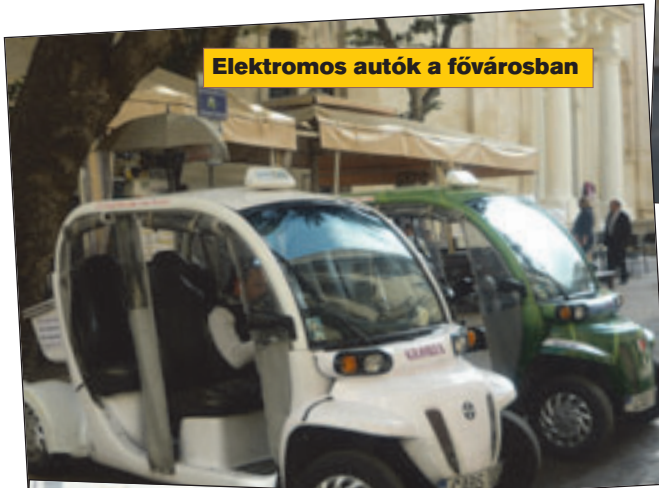
Elektromos autók a fővárosban

hogyan meg is áll a busz, mert ha az megtelt, akkor – értelem-szerűen – megállás nélkül folytatja útját. A tömegközlekedést csak az veheti igénybe, aki előre (!) fizetett a szolgáltatásért. Csak az első ajtókon lehet felszállni a buszokra, előreváltott – műanyag kártya alapú – jeggyel, bérlettel, vagy a buszvezető-nél lehet jegyet váltani. Itt ne olyan görög megoldást képzel-jünk el, hogy egy jegy ára a pénztárgépben, egy jegy ára a buszvezető zsebében landol. Minden bevétel megy a társa-ság kasszájába, az ellenőrök ügyes kis kártyaleolvasóhoz ha-sonló szerkezettel ellenőrzik, hogy váltott-e mindenki jegyet? A menetrend csak arra való – Moldova György után szaba-don –, hogy tudni lehessen, mennyit késik a buszjárat. Fél-órás késés éppúgy előfordulhat, mint az,