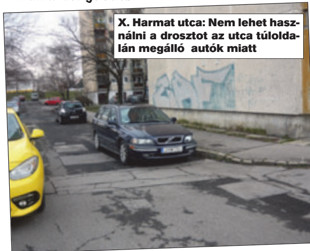
X. Harmat utca: Nem lehet használni a drosztot az utca túloldalán megálló autók miatt

Nem lehet rendeltetésszerűen használni a drosztot, az út másik oldalán parkoló autók miatt. Kérjük ott megtiltani a megállást. A kért és jogos megállási tilalom kérése bevezetésre kerül.