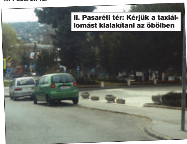
II. Pasaréti tér: Kérjük a taxiállomást kialakítani az öbölben

A körforgalom kialakításakor megszűnt a taxiállomás a téren, a hírek szerint a templom előtt lett volna a droszt, már az öblöt is kialakították. Kérjük a taxiállomást kialakítani.