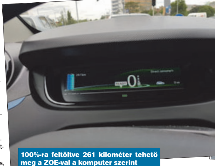
100%-ra feltöltve 261 kilométer tehető meg a ZOE-val a komputer szerint

Amit felsoroltam, egyáltalán nincs kapcsolatban az elektromos autók fejlesztésével. Nem érinti azokat, akik kertés családi házakban laknak, vagy autójukat telephelyen tartják. Itt a töltés tényleg megoldható kényelmesen. Nyilván egy idő után majd fizetni is kell érte, de ez ma még közterületeken ingyere