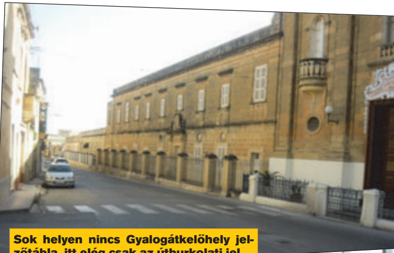
Sok helyen nincs Gyalogátkelőhely jel-zőtábla, itt elég csak az útburkolati jel

hogyan idő előtt elindul a busz, ugyanis ha az megtelt a vég-állomáson, akkor elindítják. Figyelnünk kell a járatok számo-zására is, mert van olyan, hogy ugyanarról a végállo-másról ugyanarra a végállo-másra két járat is megy, ám az egyik „direktben”, gyorsjáratú buszként, míg a másik „város-nézést” csinál, ide-oda be-megy, utána folytatja az útját.