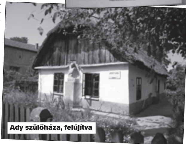
Ady szülőháza, felújítva