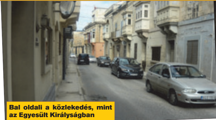
Bal oldali a közlekedés, mint az Egyesült Királyságban

A körforgalomnál is figyelni kell a fordított forgalmi rendre