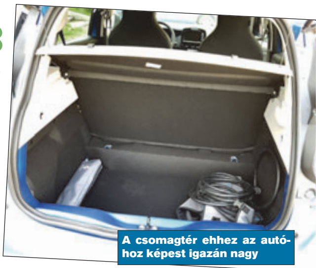
A csomagtér ehhez az autohoz képest igazán nagy

A ZOE-t gondoltam, kipróbálok hétvégén is, vagyis elmegyek vele a Tiszához. (120 kilométer oda, 120 vissza, ha nem megyek máshova. Mentem volna, hosszú hétvége volt.) Gondoltam, feltöltöm a ház konnektoráról. Letettem róla, mert normál konnektorról 25-27 óra a teljes feltöltési idő, ha a ház elektromos rendszere földelt, és nem 0-ra kötött. Ki tudja? Vagy bemehettem volna Szolnokra (újabb 30 kilométer oda,