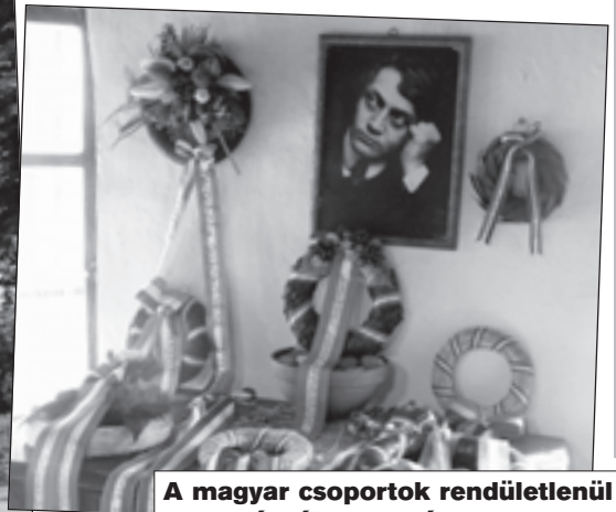
A magyar csoportok rendületlenül koszorúzzák az emlékhelyet