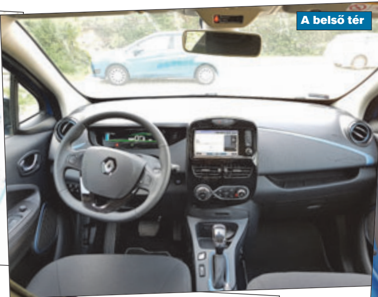
A belső tér