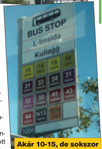
Akár 10-15, de sokszor 20-25 járat is megáll a megállóban

sokban egyáltalában nincs, ilyenek csak az Unió segítségével nemrégiben épült autótutak mentén láthatók. A lakott területeken jelzőtáblákkal kérik az autósokat és a kerékpárosokat „a békés egymás mellett élésre”.