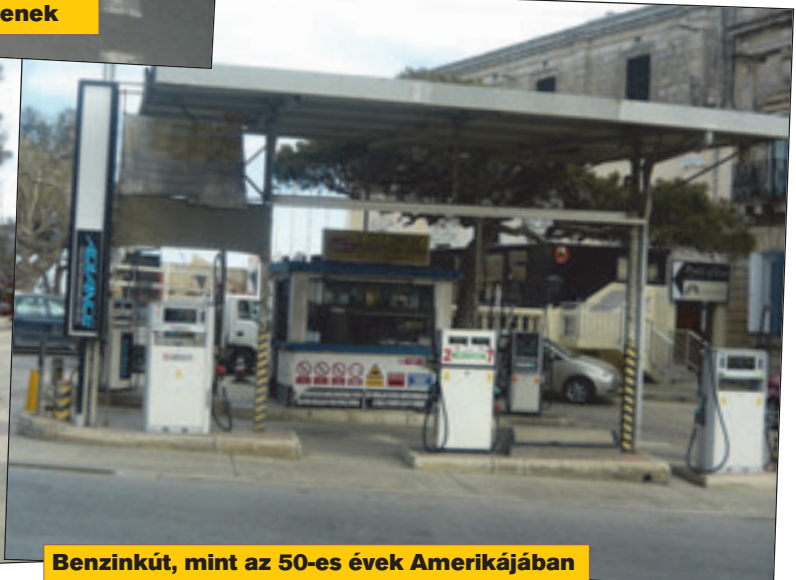
Benzinkút, mint az 50-es évek Amerikájában