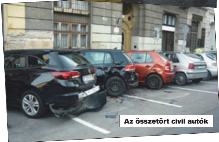
Az összetört civil autók