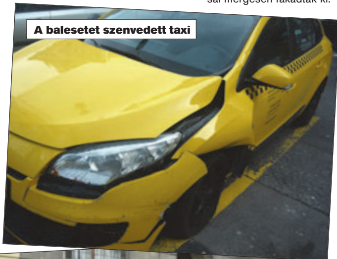
A balesetet szenvedett taxi

Csak annyi a biztos, hogy néhány nappal ezelőtt, az éjszakai órákban, Budapesten, a VII. kerületi Klauzál téren egy taxis összetört néhány békésen parkoló autót. Másnap reggel az autók tulajdonosai mérgesen fakadtak ki: