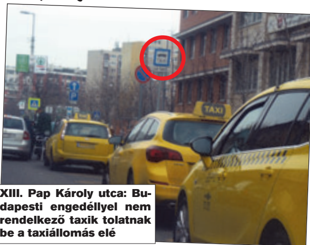
XIII. Pap Károly utca: Budapesti engedéllyel nem rendelkező taxik tolnak be a taxiállomás elé

Sajnos itt is „csiki-csuki” taxiállomás van, a droszt elé betoltnak budapesti taxiengedéllyel nem rendelkező taxik. Taxis kollégák javaslata, hogy helyezték előbbre a drosztot, hogy ne lehessen betoltni.