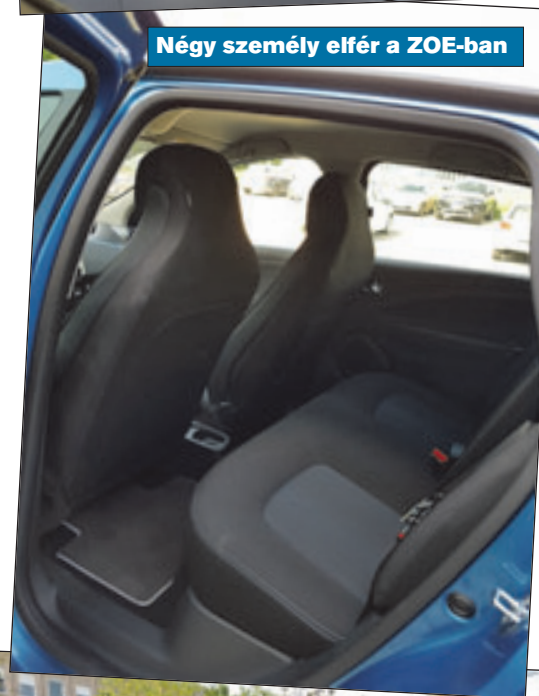
Négy személy elfér a ZOE-ban

nes. Ám ha magánterületen van a töltő, például egy szálloda parkolójában, ott a kollégáinktól 3000 forintot kértek a használatért. Amennyiben sikerül a töltés idejét jelentősen csökkenteni, és a töltőhelyek számát többszörösére hatványozni, megoldódhat a probléma is. Ehhez viszont a kisebb településeken ki kell cserélni a teljes elektromos hálózatot, mert az elavult vezetékek, transzformátor-állomások ezt a terhelést nem bírják majd. Rossz nyelvek szerint volt, hogy a töltés mellé a hajszerítőt használni már nem fért bele, a biztosíték „lecsapott”. A városokban pedig a meglévő, amúgy is kevés parkolóhely mellé mindenhova töltőket kell építeni, hogy a lakosság ne verekedjen össze a felhasználáson.