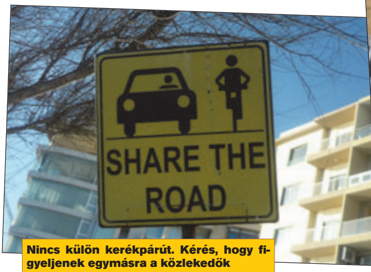
Nincs külön kerékpárút. Kérés, hogy fi-gyeljenek egymásra a közlekedők