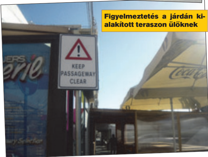
Figyelmeztetés a járdán ki-alakított teraszon ülőknek