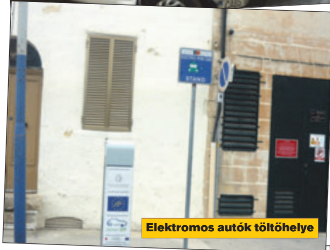
Elektromos autók töltőhelye