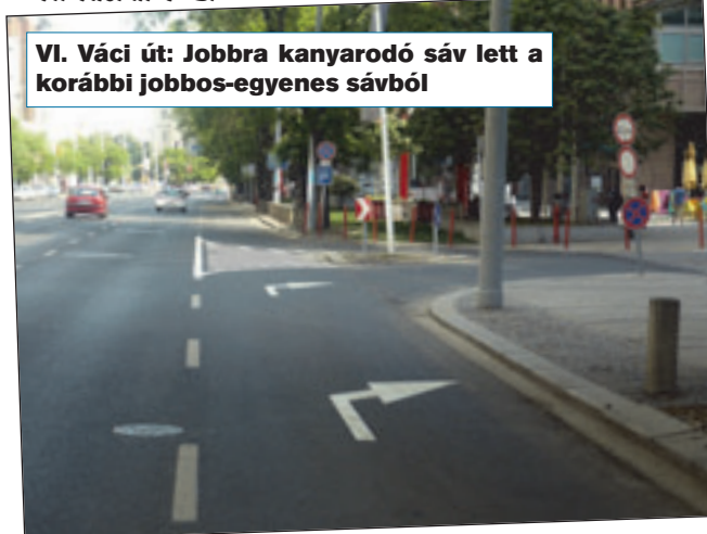
VI. Váci út: Jobbra kanyarodó sáv lett a korábbi jobbos-egyenes sávból

Jobbra kanyarodó sávot alakítottak ki a szélső sávból, megkönnyítve a kihajtást a WESTEND bevásárlóközpont HILTON szálloda kijáratánál.