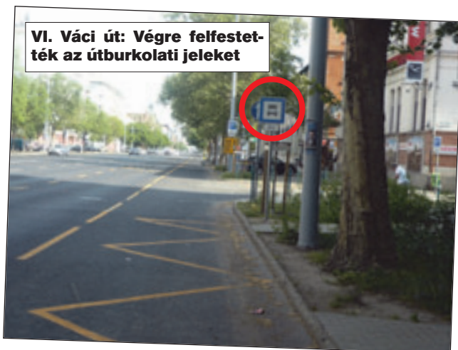
VI. Váci út: Végre felfestették az útburkolati jeleket

Decemberben megszűnt a taxiállomás a Lehel téren, ide helyezték a drosztot, amit azóta sem tudunk használni útburkolati jelek hiányában. Ígéretet kaptunk a felfestés pótlására, miután az nem történt meg, ismét kérjük.