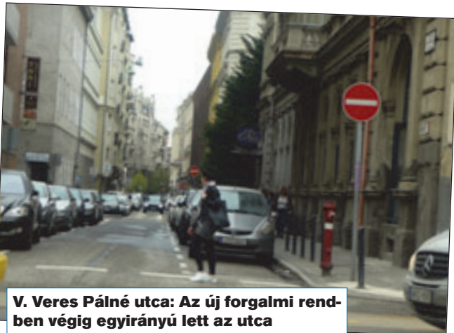
V. Veres Pálné utca: Az új forgalmi rendben végig egyirányú lett az utca

„Kifelé” lett egyirányú az utca Só utca és Vámház körüti, eddig kétirányú szakasza. A Só utcát ezután – például a repülőtérrel – a Kálvin tér, Kecskeméti utca, Szerb utca, Veres Pálné útvonalon lehet megközelíteni.