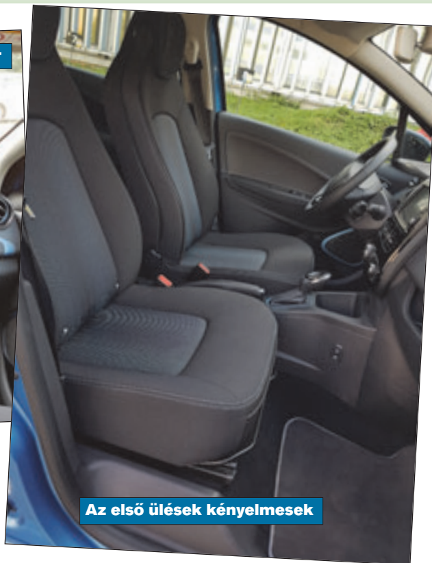
Az első ülések kényelmesek