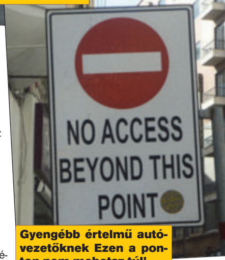
Gyengébb értelmű autó-vezetőknek Ezen a pon-ton nem mehetsz túl!

Kevés turista ismeri a piros színű kisbuszok hálózatát, nem reklámozzák az utazási irodák ezt a szolgáltatást, elsősorban a helyi lakosok veszik igénybe. Meghatározott útvonalakon járnak, – mint évtizedekkel ezelőtt Budapesten az „IRÁNYTAXIK – bárhol le lehet inteni és bárhol le lehet szállni róla. Olyasmilyen a rend-szer, ami Törökországban látható, nagyon népszerű, főleg az éj-