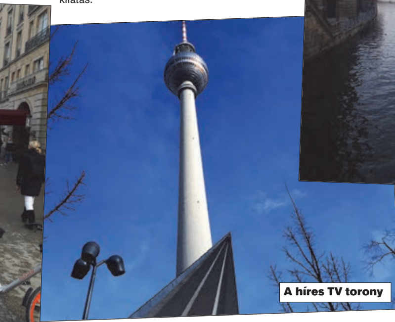
A híres TV torony

Na és persze a taxik. Az alatt a néhány nap alatt, amit ott töltöttünk, a következő statisztikát készítettem: a taxik 90%-a Mercedes, a többi nagyrészt Toyota Prius, és elvéve találoztunk Volkswagennel, vagy Peugeot-val. Egyszer egy hagyományos londoni taxit is láttunk, a jellegzetes német taxiszínnel. Berlinben működik az UBER is, a helyi taxitarifával. A mobiltelefonos útvonalkereső a tömegközlekedés mellett az Uber és a Mytaxi szolgáltatásait ajánlja fel.