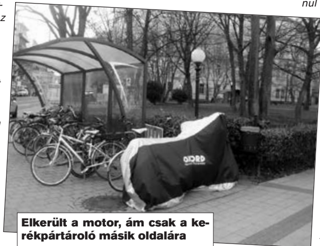
Elkerült a motor, ám csak a kerékpártároló másik oldalára

Kerületünkben csak két esetben történik járműszállítás. Az egyik, ha a jármű valamelyik tömegközlekedési útvonalon okoz forgalmi fennakadást, de ebben az esetben a Budapesti Közlekedési Központ önállóan intézkedik a jármű eltávolításáról. A másik, ha az adott jármű üzemképtelen járműnek minősül, és tulajdonosa felhívásunk ellenére nem távolítja el, akkor megrendeljük a jármű elszállítását közterületről. A szóban forgó eset egyik kategóriába sem tartozik, így arra nincs lehetőség, hogy a motorkerékpárt elszállítsuk.