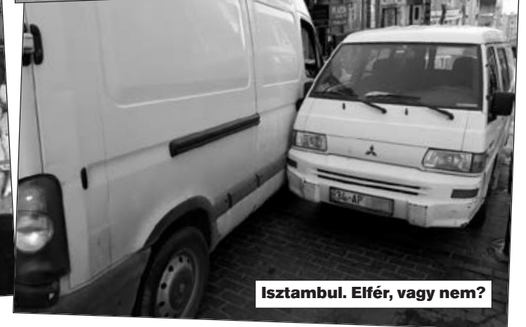
Isztambul. Elfér, vagy nem?