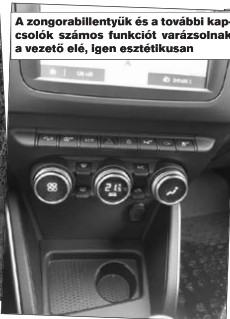
A zongorabillentyűk és a további kapcsolók számos funkciót varázsolnak a vezető elé, igen esztétikusan

Az autó megerősített vázzal rendelkezik: az új karosszéria sínei és lemezei 0,2 mm-rel vastagabbak, és jobb mechanikai tulajdonságokat biztosítanak; új a merevítés (A-oszlop, padló alatti gerendák). Ezen kívül még az alábbi új biztonsági felszerelések találhatók rajta: új üléskeret; új és nagyobb, vastagabb fej támasz az elülső üléseken, amelyek hátulról érkező ütések esetén jobb védelmet biztosítanak; új függőnylégzsákok; pirotechnikai előfeszítők, erőhatárolókkal az el-