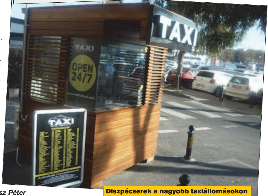
Diszpécserok a nagyobb taxiállomásokon

Az útinapló második részében a máltai közlekedésről számolok be, majd a harmadik részben a mindennapi életéről.