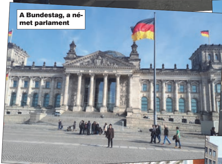
A Bundestag, a német parlament