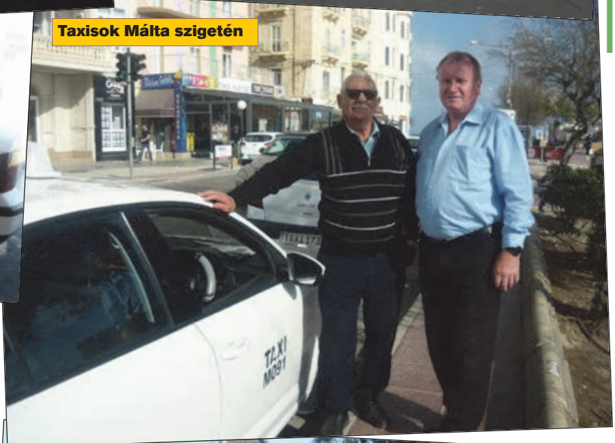
Taxisok Málta szigetén

A taxikat le lehet inteni az utcán, vagy a taxiállomáson lehet igénybe venni a szolgáltatást, a CAB autók csak előzetes telefonrendelésre állnak ki, utcán nem lehet őket leinteni. A CAB autók rendszámának utolsó betűje az előírás szerint „Y” betű, erről lehet őket felismerni. A taxik használhatják a buszsávokat és az úgynevezett PUBLIC TRANSPORT utakat, a CAB autók csak akkor, ha legalább három utasuk van. Hasonló a helyzet, mint Izraelben, a taxik ott is használhatják a buszsávokat, a civil autók csak akkor, ha legalább négyen ülnek benne.