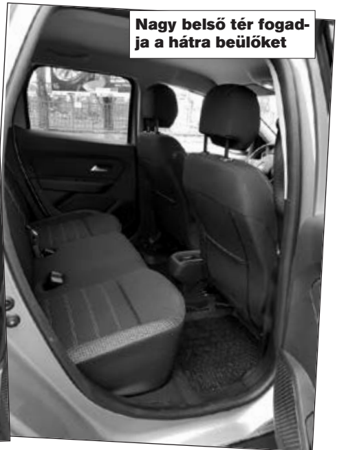
Nagy belső tér fogadja a hátra beülőket