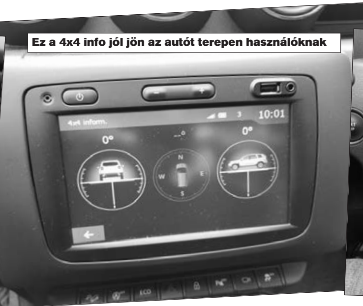
Ez a 4x4 info jól jön az autót terepen használóknak