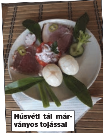
Húsvéti tál márványos tojással