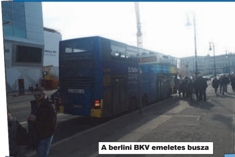
A berlini BKV emeletes busza

A tömegközlekedés egyébként jónak mondható, buszok, villamosok, U-Bahn és S-Bahn. Az U-bahn felel meg a földalattinak, dacára annak hogy helyenként magasvasútként üzemel. Az S-Bahn meg