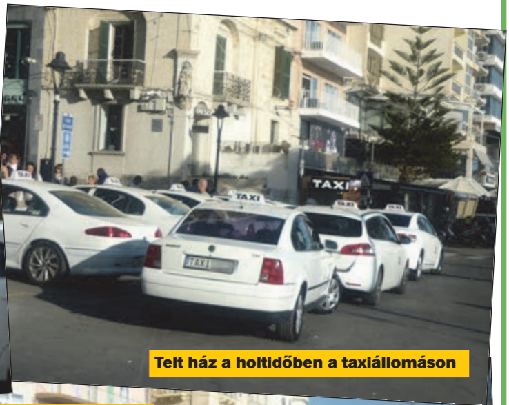
Telt ház a holtidőben a taxiállomáson