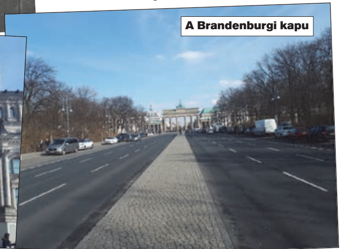
A Brandenburgi kapu