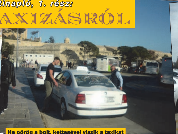
Ha pörög a bolt, kettessel viszik a taxikat

All Taxi Rates are inclusive of: Up to 4 persons & up to 4 normal sized luggage. All week any time including Sundays & Public Holidays. Any tips you might wish to pay are not included. All tariffs to increase by €5 on the 25 th December & 1 st January