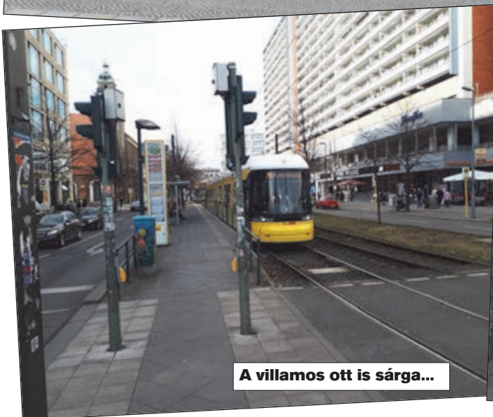
A villamos ott is sárga...