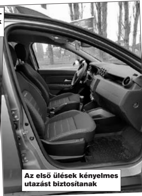
Az első ülések kényelmes utazást biztosítanak