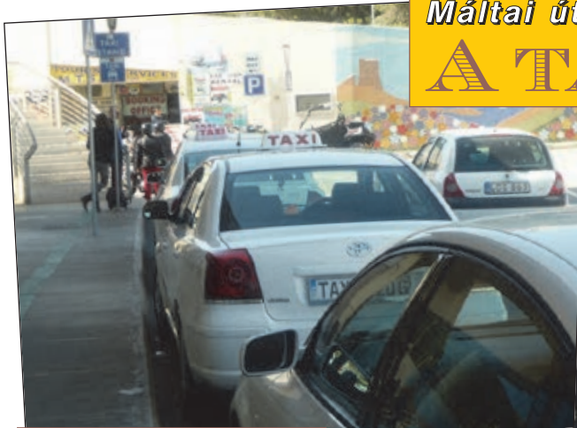
Taxiállomás GOZO szigetén

Máltán a személygépkocsis személyszállítást taxikkal és úgynevezett CAB limuzin autókkal látják el. A legfontosabb a máltai taxikkal kapcsolatban, hogy nincs taxióra a taxikban. Persze, ne olyan ukrán taxizást képzeljünk el, hogy „Gyere tesókám, majd megbeszéljük, mennyi legyen a fuvar vége!” Málta kicsi ország, gyakorlatilag akkora, mint Budapest, fővárosa – La Valetta – hivatalosan is Európa legkisebb fővárosa, egy főutcából és néhány tucat mellékutcából áll.