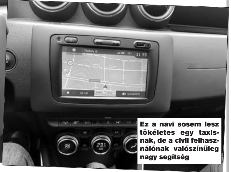
Ez a navi sosem lesz tökéletes egy taxinak, de a civil felhasználónak valószínűleg nagy segítség

zálékkal csökkenti, ami különösen parkolás esetén hasznos. A kormányzás egy olyan rendszeren keresztül történik, amely a rásegítés mértékét a sebességtől függően változtatja, hogy az autópályán jobb legyen az iránytartása. Sokkal jobb a kormány reakcióképessége is, különösen terepen való vezetés esetén. Az autóban van egy több látószögű monitor is, amely négy kamera képét mutatja (egy elöl, egy-egy oldalt és egy hátul). A rendszer lehetővé teszi a vezető számára, hogy a jármű körül mindenhol lássa a környezetét, de parkoláskor is nagyon hasznos ez a segítség. Hátramenetbe kapcsolva automatikusan bekapcsolódik. A kamera kézzel hozható működésbe. A felhasználóbarát navigációs kijelző egyszerre csak egy kamera képét mutatja és automatikusan ki is kapcsol, ha a jármű sebessége túllépi a 20 km/órát. Az oldalsó kamerák a külső tükrökön helyezkednek el, így az elülső kerekekre közvetlenül rá lehet látni.