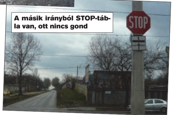
A másik irányból STOP-tábla van, ott nincs gond

Miért? A Gitár utca jobb oldalán egy széles, szabad terület van, a látómező önkéntelenül jobbra kitégul. Nagyobb lesz a látótér, több az információ és a figyelmetlen autós nem veszi észre a látómező