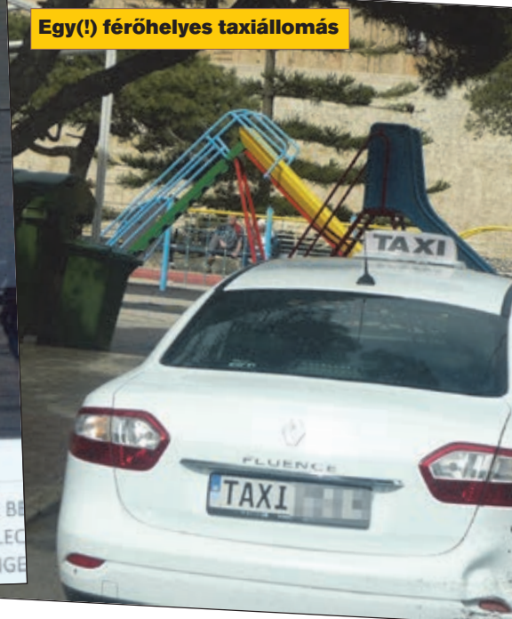
Egy(!) férőhelyes taxiállomás