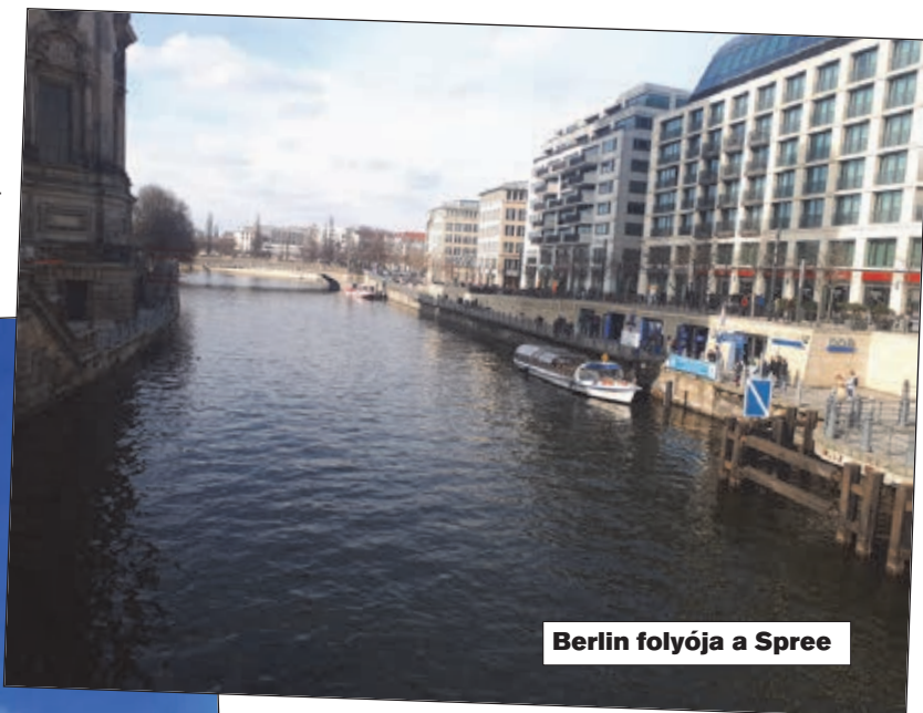
Berlin folyója a Spree

A közlekedés drága is, meg nem is. Egy AB zónára érvényes vonaljegy 2,80 euró, ez két órán keresztül érvényes átszállás esetén is. Jobban megéri a napijegy, ennek ára 7 euró, de egy napig korlátlanul érvényes buszra, villamosra, U-Bahnra. Napijeggyel akár egy városnézést is ki lehet váltani, az emeletes buszok felső szintjéről kiváló a kilátás.