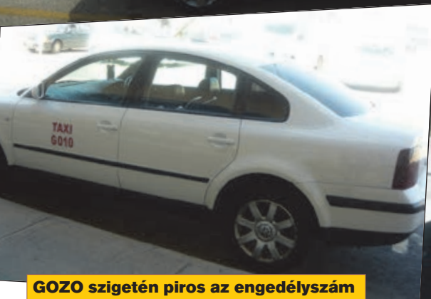
GOZO szigetén piros az engedélyszám

rendszáma van, így egyhamar ki lehet, ki lehetne szűrni az engedély nélkül szolgáltatókat... Egyetlen letakart TAXI szabadjelzőjű taxit, egyetlen TAXI szabadjelzős, de nem TAXI rendszámú járművet nem láttam Máltán. Talán nem véletlen... Nincsenek engedély nélkül szolgáltatók!