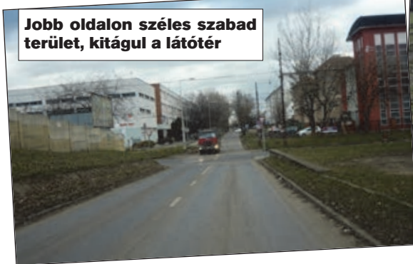
Jobb oldalon széles szabad terület, kitégul a látótér