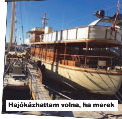
Hajókázhattam volna, ha merek

Utvonal: Ausztriából át a Brenneren, Bolzano, Trento, aztán Brescia, Milano, Torino, majd a franciaországi Grenoble érintésével Valence, Montpellier, és a csodás tengerparti kocsikázás után Barcelona.