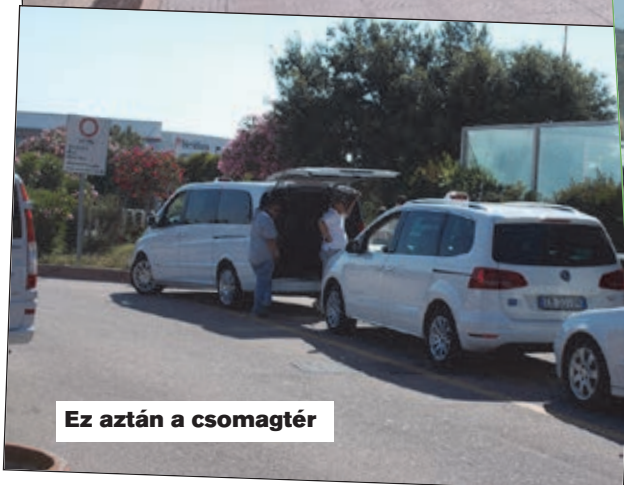
Ez aztán a csomagtér