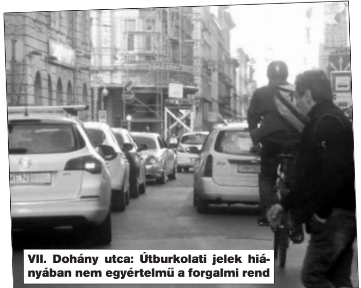
VII. Dohány utca: Útburkolati jelek hiányában nem egyértelmű a forgalmi rend

Helyismerettel nem rendelkezők nem tudják, hogy a jobb oldali sáv egy trolibuszmegálló, a bal oldali a forgalmi sáv a Kertész utca előtt. Sokan a jobb oldali sáv