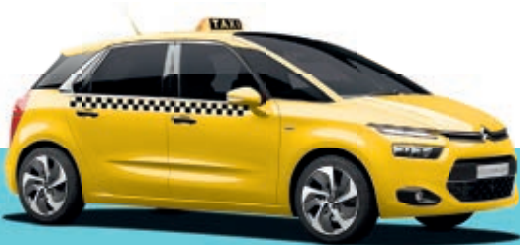
CITROËN C4 PICASSO

VÁLASSZON OLYAT, AMELYBEN SZÍVESEN TÖLTI IDEJÉT!