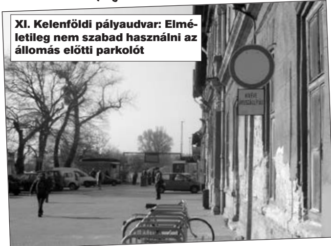
XI. Kelenföldi pályaudvar: Elméletileg nem szabad használni az állomás előtti parkolót

■ „Mindkét irányból behajtani tilos, kivéve ÁRUSZÁLLÍTÁS” jelzőtábla van a pályaudvar előtt, de ezt senki sem veszi komolyan, mert akkor nem lehetne használni a hatalmas parkolót. Kérjük a feleslegesnek tűnő jelzőtáblát leszerelni.