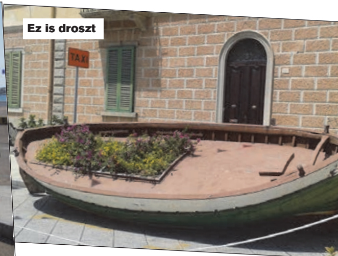
Ez is droszt

A szárdok furcsa népség. Maguknak valók, gyanakvóak, bizalmatlanok, de akit befogadnak, azzal feloldódnak. A turistaövezetekben mindenki kedves, segítőkész, ott nincs gond. Mesélhetnek neked a sziget zezugos partvonalainak álomszép öbleiről, a kristálytisza tengervízről, a partmenti bájos kis szigetekről, vagy a történelmi emlékekről, de inkább a taxisok világáról számolok be. A tíz nap alatt