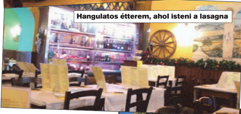
Hangulatos étterem, ahol isteni a lasagna