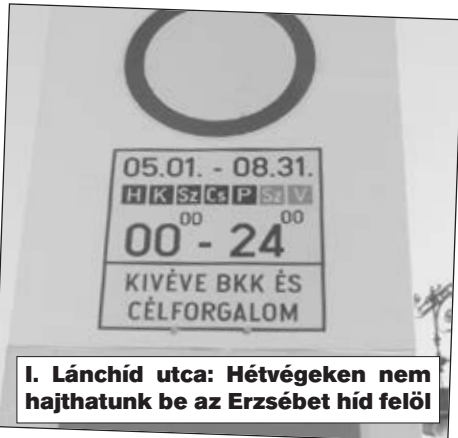
I. Lánchíd utca: Hétvégeken nem hajthatunk be az Erzsébet híd felől