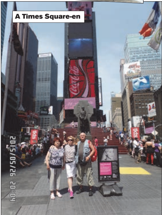
A Times Square-en