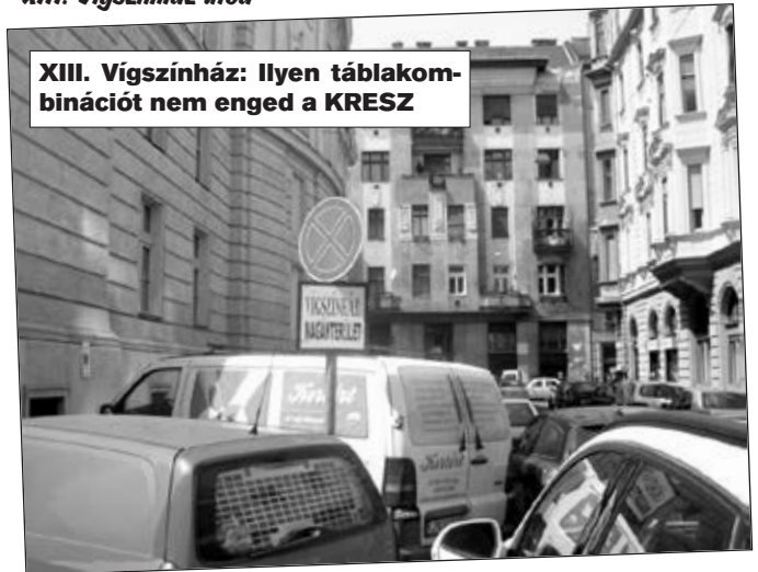
XIII. Vígszínház: Ilyen táblakombinációt nem enged a KRESZ

■ „Megállni tilos, VIGSZINHÁZ MAGÁNTERÜLET” jelzőtábla van a színház mögött, a járdán. Célszerű lenne a „Megállni tilos” jelzőtáblát lecserélni „Várakozni tilos” jelzőtáblára.