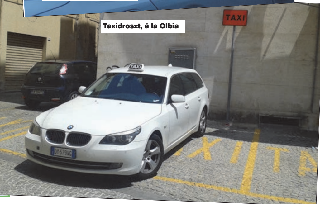
Taxidroszt, á la Olbia

ruhás, egy szál se, nem kérdez tőlem a kutya se semmit, és máris kint vagyok a kis reptéri épület előtt. Ahol összesen 8, azaz nyolc hófehér taxi áll szépen libasorban. Ami első blikkre feltűnik; vakítóan tiszták kívül is, belül is, és csupa cigimentes, nagy kocsi. BMW, Audi, Merc, Ford. És nem aggasztánok! Amott egy oldalsó csarnokban kisebb tömeg tiporja egymás lábát a bérautóirodák előtt. Normálisak ezek? A szállodákhoz ingyen kiviszik a legények a verdát!