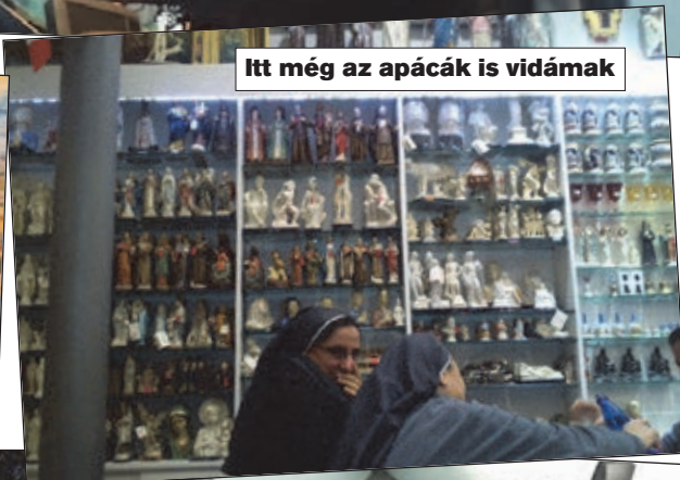
Itt még az apácák is vidámak

fél órát vezethetek. Es a két vezetési idő között 45 perc pihenőt kell tartani.