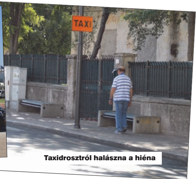
Taxidrosztról halászna a hiéna

engedéllyel minibuszos iránytaxikat indítanak strandokra, szállodákhoz, vagy máshová, ennek sem örülnek a helyi taxisok. Akik ugyanígy, mint te is, szintén 8-10-14 órát töltenek műszakban, de aki alkalmazott, annak kötelező heti egy pihenőnapot tartania. Turistaszezon az van, az április és október a németeké, májusban és júniusban a franciák jönnek, a július-augusztusi döngmeleg az az olaszoké. Ami érdekes, a 7 taxisofőröm közül eddig csak egynek volt magyar utasa, a többiek magyar polgárt még nem láttak. Télen hosszú szieszta van, munkalehetőség nulla. Nagy ritkán beesik néha egy orosz vagy egy arab utas.