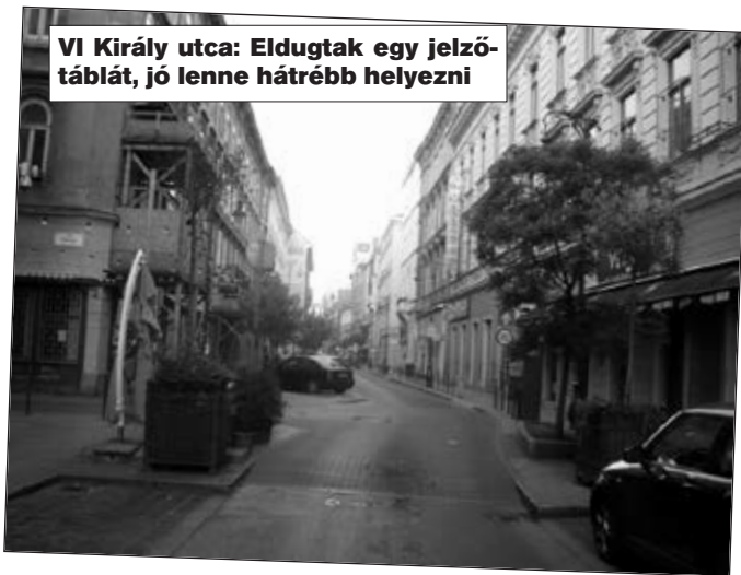
VI Király utca: Eldugtak egy jelzőtáblát, jó lenne hátrébb helyezni

■ A „Behajtani tilos” jelzőtábla nagyon elől van, ráadásul elforgatva, ezért nem látható. Jó lenne hátrébb tenni és kihelyezni egy „Kötelező haladási irány egyenesen” jelzőtáblát.