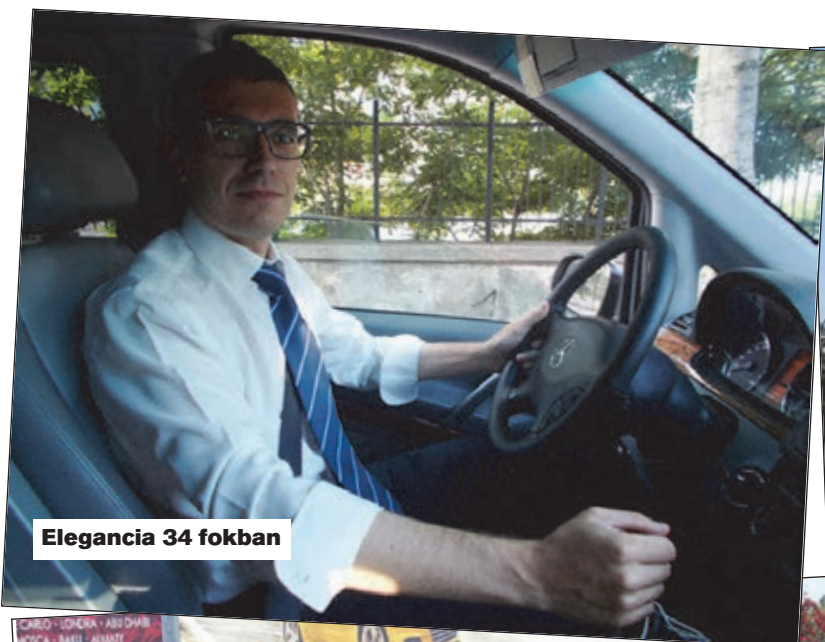
Elegancia 34 fokban