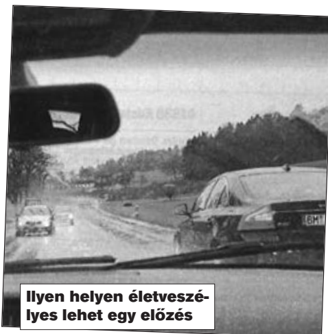
Ilyen helyen életveszélyes lehet egy előzés

Szabálysértés: Az, aki tiltott helyen előz – alapesetben – 150 euró büntetést fizet, és 1 büntetőpontot kap.