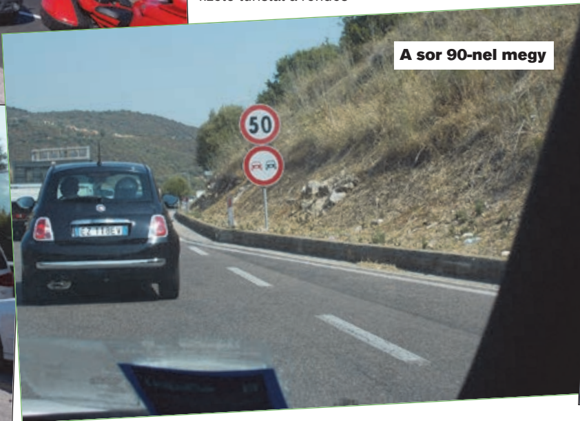
A sor 90-nel megy