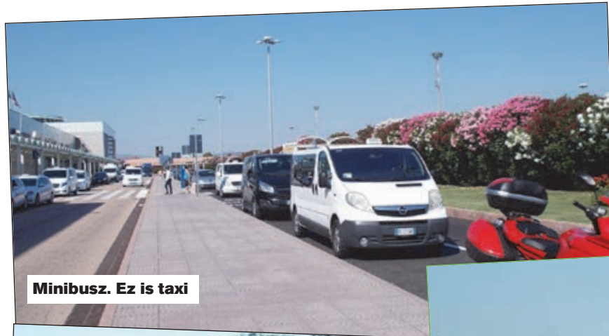
Minibusz. Ez is taxi

A következő kaszt az illegális, azaz autóval rendelkező, képzetlen, nem adózó, engedély nélküli ember-szabású dögevívő emlős, aki levadássza az utcán a jól fizető turistát a rendes