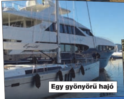
Egy gyönyörű hajó