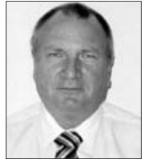
A Lámpafelelős Fótaxi URH 558