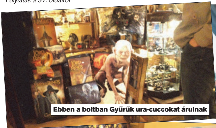
Ebben a boltban Gyűrűk ura-cuccokat árulnak