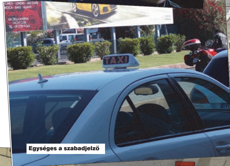
Egységes a szabadjelző