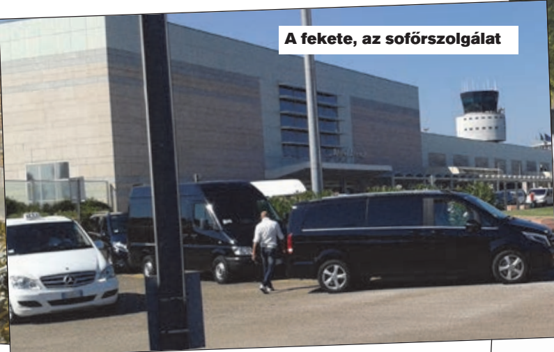
A fekete, az sofőrszolgálat

ember elől. Ott is. Ennek 3000 euró a büntetése, de mégis vannak. Rejtély a köbön. Amikor az UBER-t említettem, elborultak a tekintetek, majd közölték, Olaszország keményen betiltotta ezt a „gengszterbandát”. Így mondták. Egyes társaságok