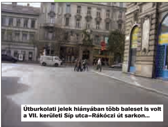
Útburkolati jelek hiányában több baleset is volt a VII. kerületi Síp utca-Rákóczi út sarkon...