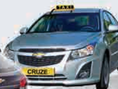
Chevrolet Cruze Sedan