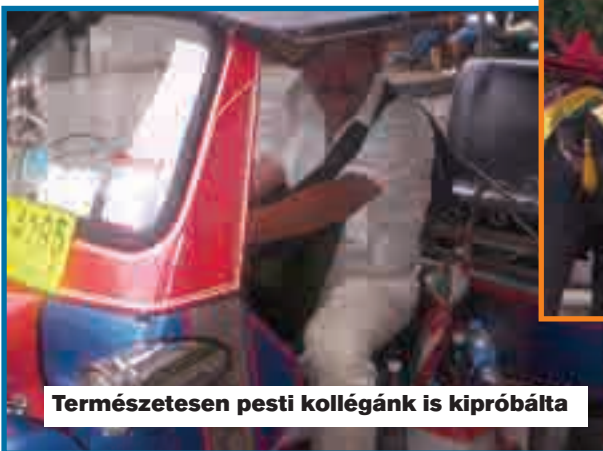
Természetesen pesti kollégánk is kipróbálta