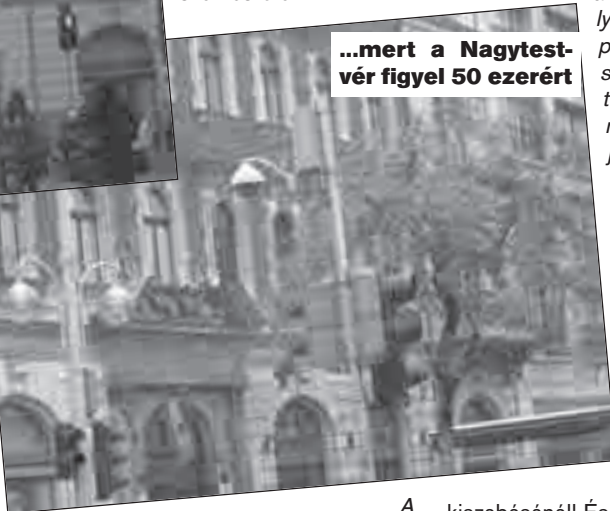
...mert a Nagytestvér figyel 50 ezerért

Budapesti Rendőr-főkapitányság által – korábban (J. P.) – megküldött válasz félreérthető, így azt szeretnénk pontosítani. Számunkra fontos a hitelesség és szeretnénk, ha a hatályos jogszabály szerinti, professzionális tájékoztatást kapnának a rendőrségtől.