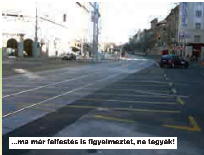
...ma már felfestés is figyelmeztet, ne tegyék!