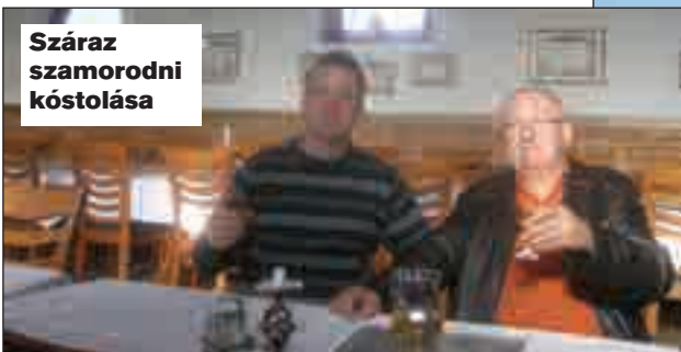
Száraz szamorodni kóstolása