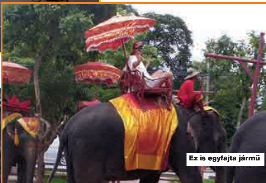
Ez is egyfajta jármű