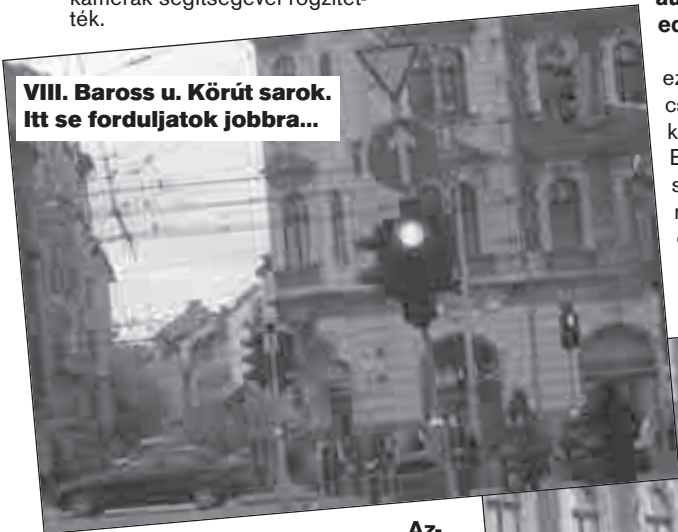
VIII. Baross u. Körút sarok. Itt se forduljatok jobbra...

Az- tán, egy évvel ezelőtt „elsötétültek” a kamerák, állítólag szakmai vita volt a rendőri vezetők és az Állampolgári Jogok Biztosa között. Valószínűleg megbékélhettek, mert „feléledtek” a kamerák. Közben kaptunk egy levelet az egyik rendőrségi illetékestől, hogy a térfigyelő kamerák segítségével – igazából – nem is lehetett volna szabálysértési eljárást kezdeményezni!