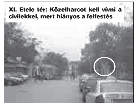
XI. Etele tér: Közelharcot kell vívni a civilekkel, mert hiányos a felfestés

A Kelenföldi pályaudvartól dolgozó kollégák kerestek meg, hogy a TAXIÁLLOMÁS jelzőtábla alatt 6 TAXI kiegészítés van, de az útburkolati jeleket csak négy autó számára festették fel. Kérjük pótolni a hiányzó felfestést.