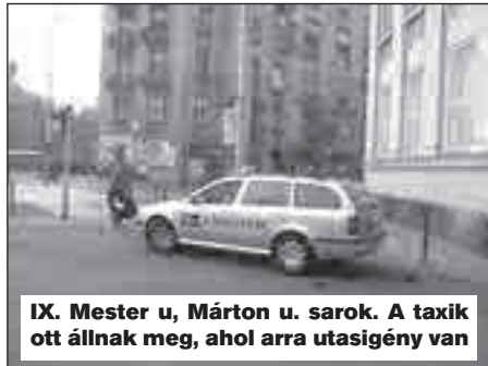
IX. Mester u, Márton u. sarok. A taxik ott állnak meg, ahol arra utasigény van

Egykor itt volt a jól pörgő „Marci” droszt, elnevezését az akkori „Marci” kocsmáról kapta. Jó lenne itt ismét taxiállomás, a taxik most is rendszeresen megállnak.