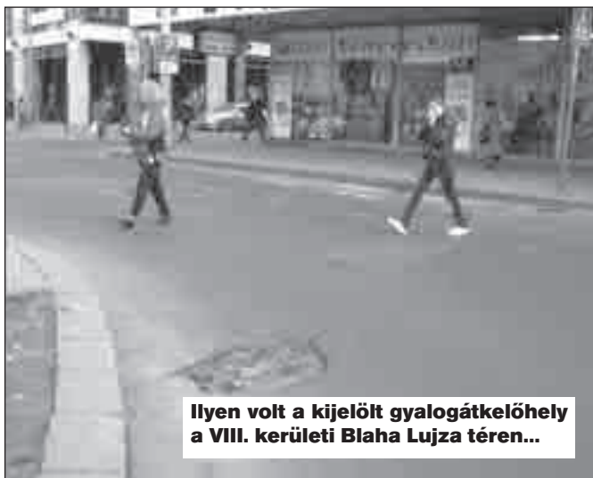
Ilyen volt a kijelölt gyalogátkelőhely a VIII. kerületi Blaha Lujza téren...