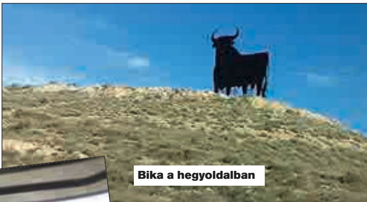
Bika a hegyoldalban

A Scan viszont még este hatkor sem érkezett meg. Fél nyolckor,