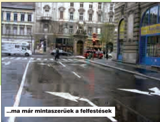
...ma már mintaszerűek a felfestések