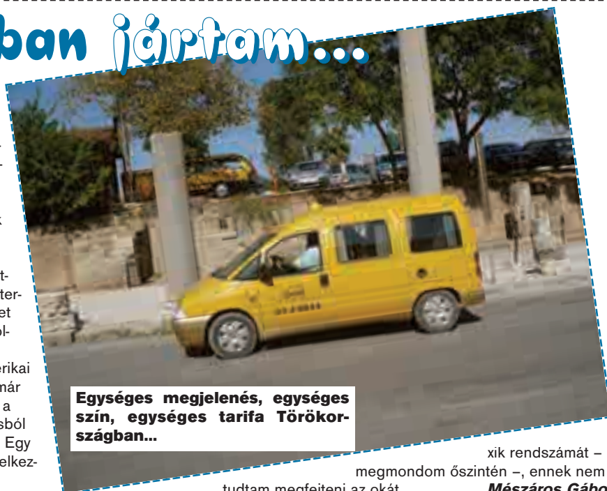
Egységes megjelenés, egységes szín, egységes tarifa Törökországban...

A taxik oldalán nagy betűkkel, számokkal kiírják a ta-