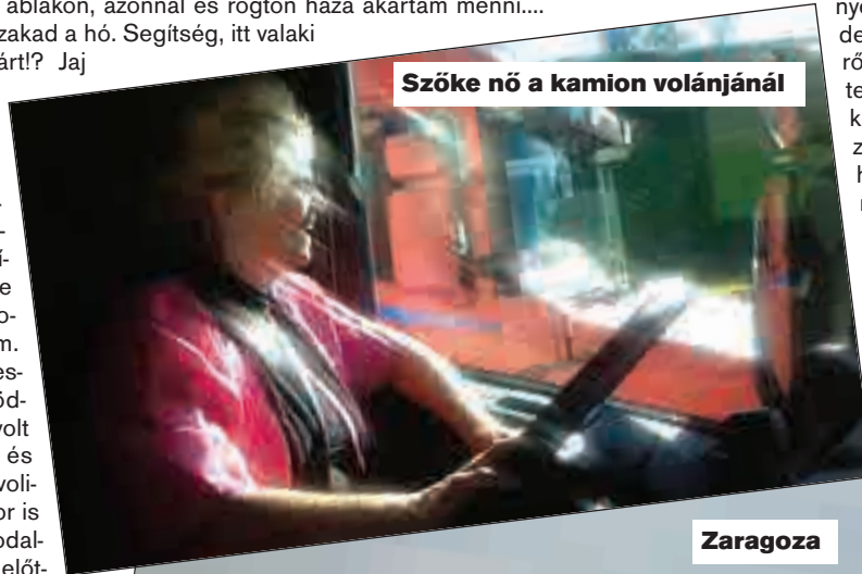
Szöke nő a kamion volánjánál

Nos, visszatérve a Scan-hoz. Magasan ötcsillagos. A legjobb ezt vezetni (azóta természetesen már vezettem, mert mire ti ezt olvassátok, már karácsony lesz, amikor a cikket Nizzában írom, november 4. van és plusz 20 fok), ez a legbiztonságosabb az összes általam ed-