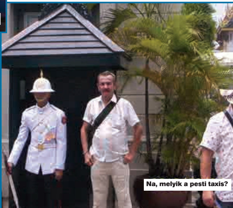
Na, melyik a pesti taxis?