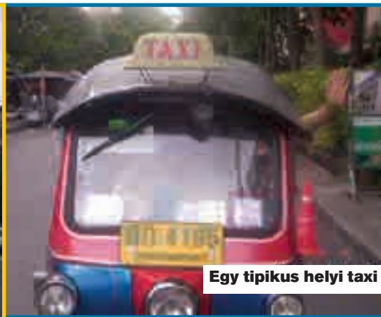
Egy tipikus helyi taxi