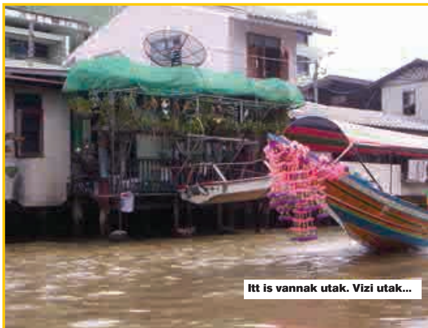
Itt is vannak utak. Vizi utak...

Két lefátyolozott nő találkozik az utcán: