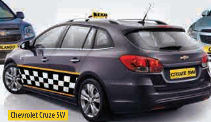
Chevrolet Cruze SW