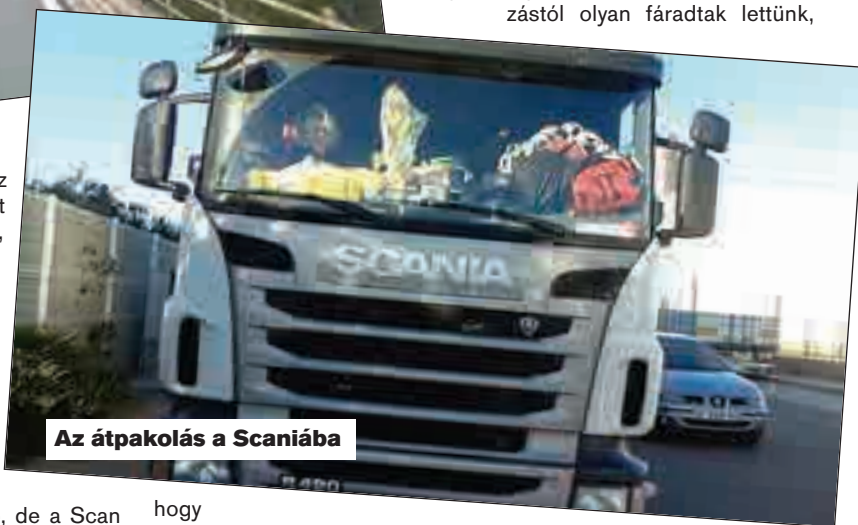
Az átpakolás a Scaniába

hogy hullottunk a gyorsan tiszta huzatba bújított paplanok alá.