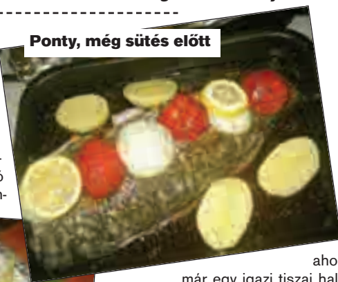
Ponty, még sütés előtt

ahol már egy igazi tiszai hal- vacsorával fogadtak, halászlé, rán- tott hallal kombinálva. Némi boro- zás mellett megbeszéltük, mi vár ránk másnap, majd