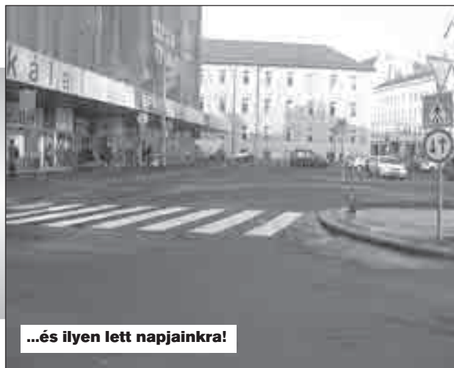
...és ilyen lett napjainkra!