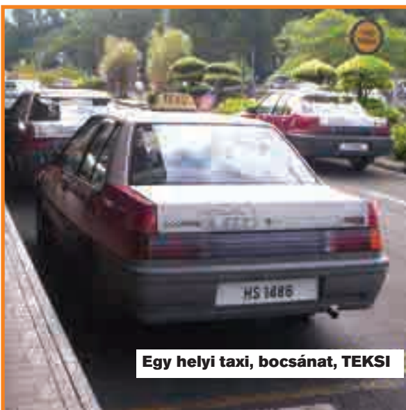
Egy helyi taxi, bocsánat, TEKSI