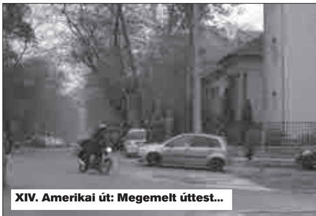
XIV. Amerikai út: Megemelt úttest...

...és jelzőtáblák figyelmeztetnek a forgalmirend-változásra