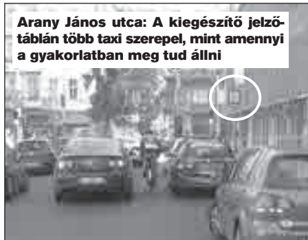
Arany János utca: A kiegészítő jelzőtáblán több taxi szerepel, mint amennyi a gyakorlatban meg tud állni

Egy éve jeleztük a problémát, sajnos semmi sem történik! A kiegészítő jelzőtábla 4 autó