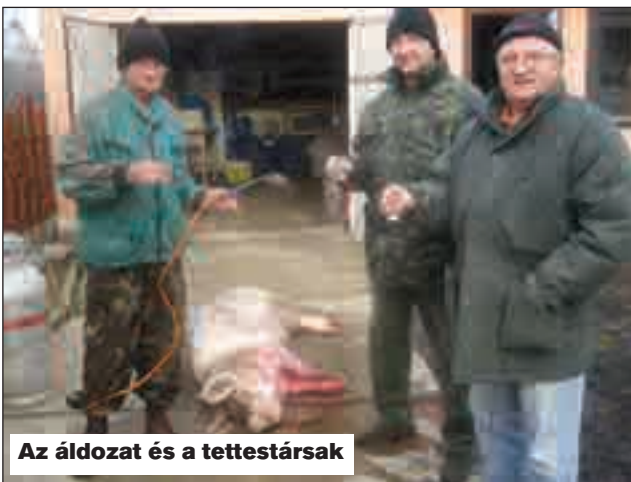
Az áldozat és a tettestársak

Mivel disznóvágásra in- dultunk a Tisza mellé, gon- doltam, innen kell valami jó bort vin-