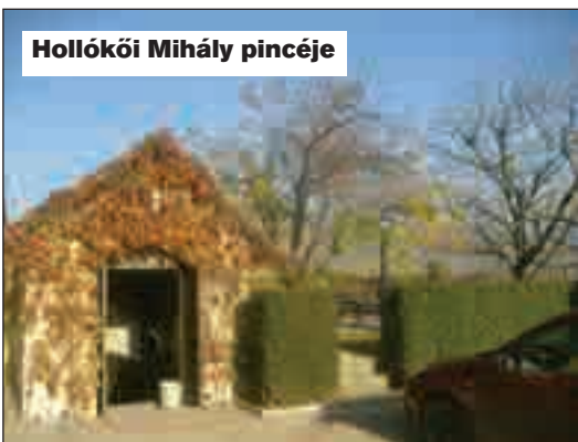
Hollókői Mihály pincéje