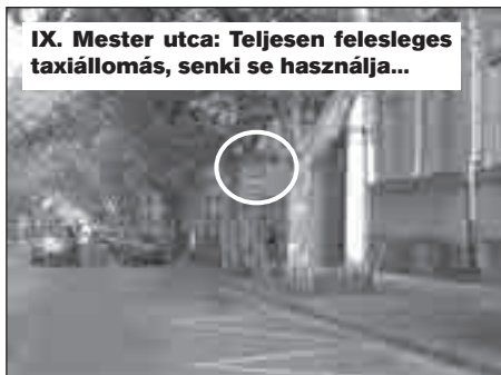
IX. Mester utca: Teljesen felesleges taxiállomás, senki se használja...

A felesleges taxiállomást meg kellene szüntetni!