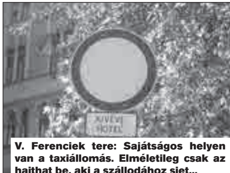
V. Ferenciek tere: Sajátságos helyen van a taxiállomás. Elméletileg csak az hajthat be, aki a szállodához siet...

Új taxiállomás született, de nagyon sajátságos helyre tették... Ugyanis csak (!) az mehet a taxiállomásra, aki a szállodához igyekszik! Mi van azokkal, akik az „utcáról” akarnak dolgozni?