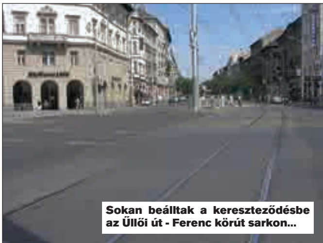
Sokan beálltak a kereszteződésbe az Úllői út - Ferenc körút sarkon...