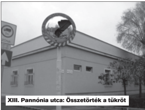
XIII. Pannónia utca: Összetörték a tükröt

■ Összetörték az út szélén levő tükröt, ■ kérjük pótolni.