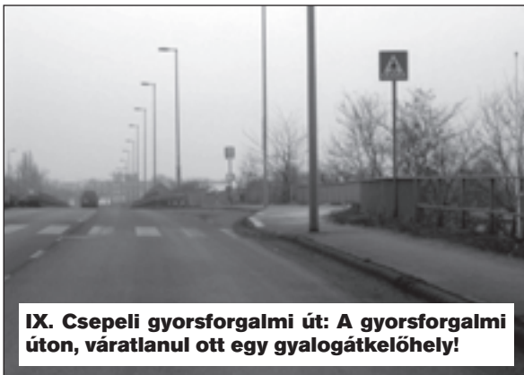
IX. Csepeli gyorsforgalmi út: A gyorsforgalmi úton, váratlanul ott egy gyalogátkelőhely!

■ Befelé haladva 70 km/óra tempóval lehet haladni, amikor a benzinkút magasságában ott van váratlanul egy gyalogátkelőhely. Jó lenne egy lassításra figyelmeztető jelzőtáblát kihelyezni.