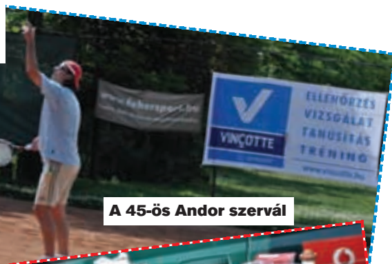
A 45-ös Andor szervál