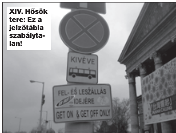
XIV. Hősök tere: Ez a jelzőtábla szabálytalan!