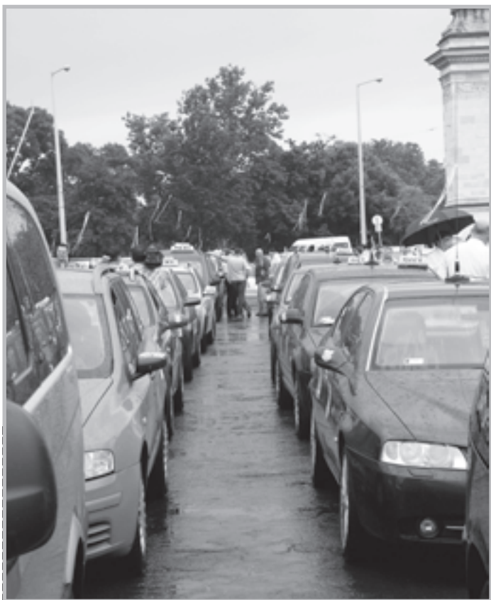
1. sz. melléklet