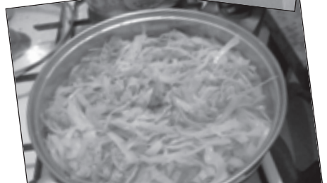
Mindössze hús, káposzta és tészta