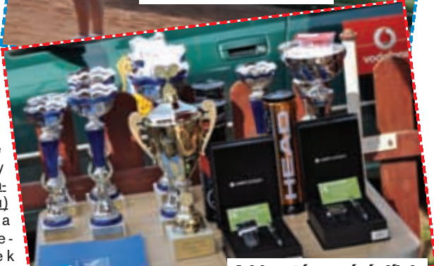
A kiosztásra váró díjak