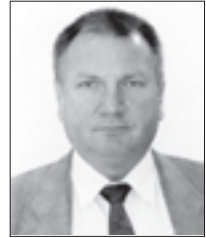
A Lámpafelelős Főtaxi URH 558