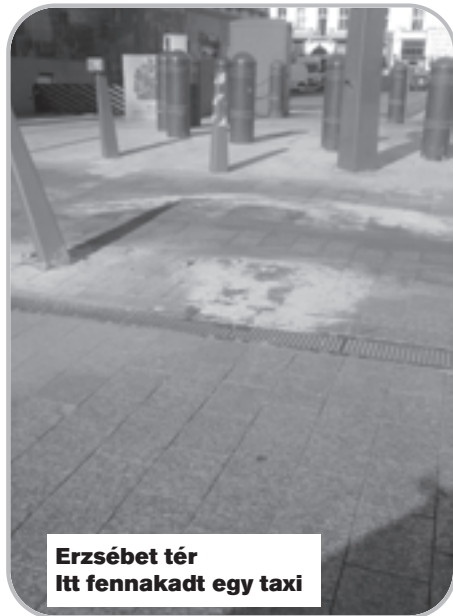
Erzsébet tér Itt fennakadt egy taxi

tó. Valaki, aki jogi végzettséggel rendelkezik, megírhatja már egy bírósági feljelentést az esetekről. Ugyanis a KRESZ egyértelműen fogalmaz: 63. § Az utak igénybevitelével kapcsolatos szabályok (1) Aki a közutat vagy a közúti jelzést megsérte, beszeny-