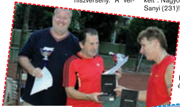
A páros győztesei