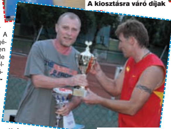
Az egyéni győztes