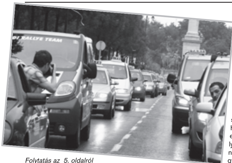
Folytatás az 5. oldalról

Ebből lett elege a taxisoknak. Meg abból, hogy ha tábláznak, az több száz forintjukba is kerülhet, már amennyiben nem érnek vis-