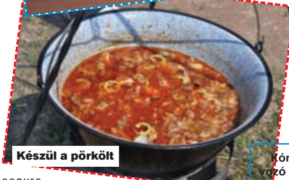
Készül a pörkölt