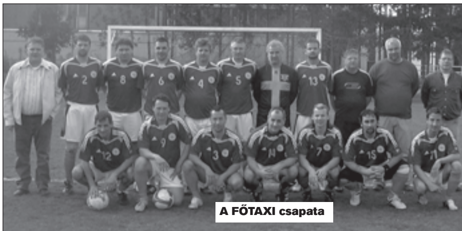
A FŐTAXI csapata