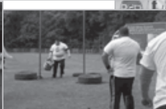
25 kg súly magasba