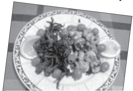
Bébi-polip garnélarákkal – feltálva