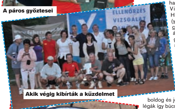
Akik végig kibírták a küzdelmet