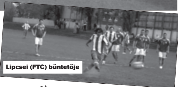
Lipcsei (FTC) büntetője

tens jól mutatta, kié a bedobás joga, de a játékvezető felülbírált és tévesen ítelt. A vendégek elvégezték ugyan a bedobást, de oly módon, hogy odadobták a labdát a hazai játékosoknak! Így a játékvezető felülbírált ugyan a partjelzőt, ám a sportszerű játékosok meg felülbírálták a játékvezetőt.