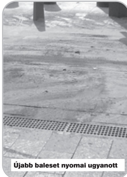
Újabb baleset nyomai ugyanott