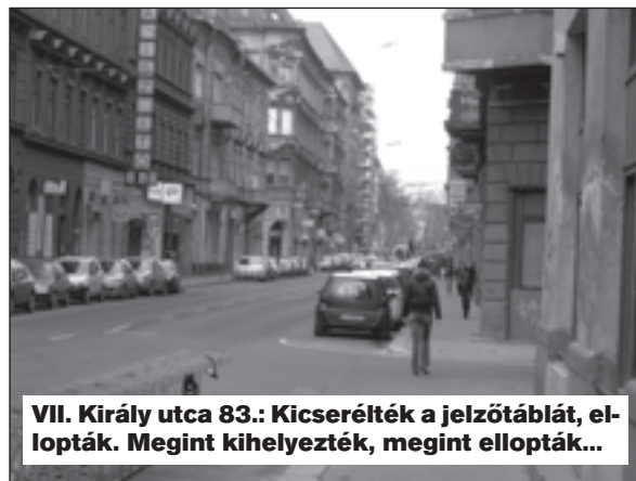
VII. Király utca 83.: Kicserélték a jelzőtáblát, ellopták. Megint kihelyezték, megint ellopták...