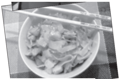
A Hórog elkészítve és tálalva