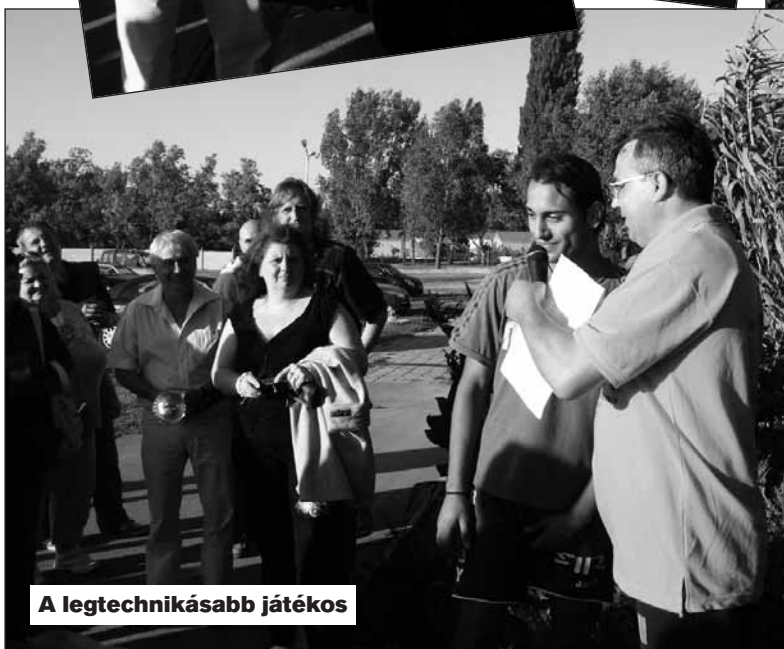
A legtechnikásabb játékos