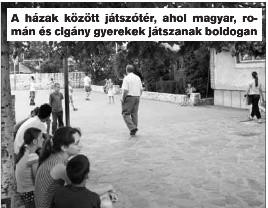
A házak között játszótér, ahol magyar, román és cigány gyerekek játszanak boldogan

pítvány) gyűjtött a kollégák körében. Ő is sikerrel járt, hiszen 120 kg junior táppal lettek gazdagabbak a kis állatok. Ebben a nehéz gazdasági helyzetben is megmutatták a kollégák, hogy jó és nemes célért még megmozdíthatóak.