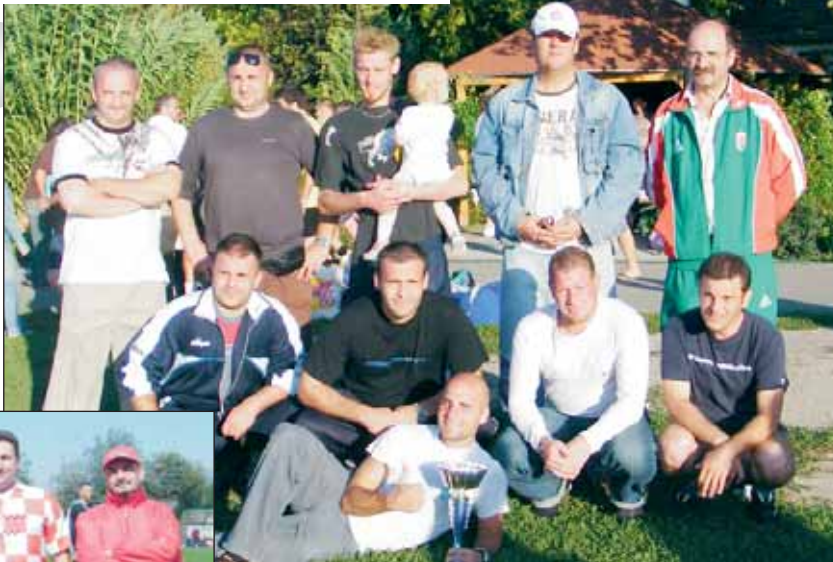
A Fótaxi győztes csapata a torna után a kupával