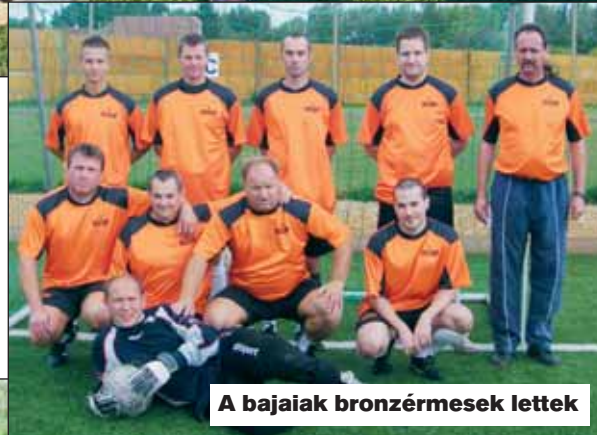
A bajaiak bronzérmesek lettek