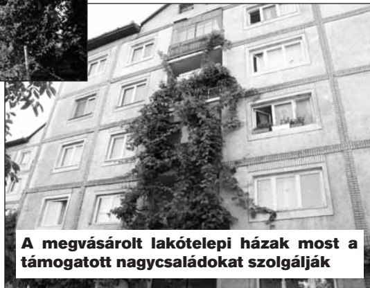
A megvásárolt lakótelepi házak most a támogatott nagycsaládokat szolgálják