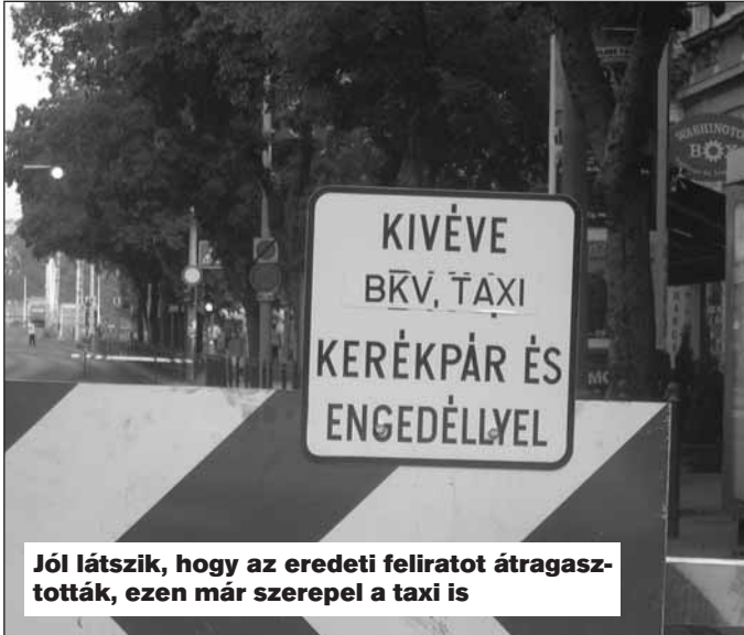
Jól látszik, hogy az eredeti feliratot átragasztották, ezen már szerepel a taxi is