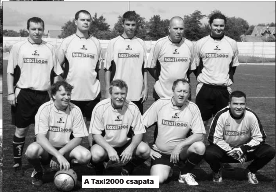
A Taxi2000 csapata