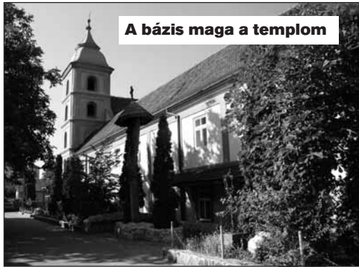
A bázis maga a templom

napon keresztül. Bízunk benne, hogy legalább egy kisbusznyai adomány összegyűlik, aminek célba juttatását magam vállaltam. Meglepődve tapasztaltuk, hogy mennyi ember hallott már az árvaházról és mennyien akarnak segíteni, nem csak Kecskemétre, hanem más városokból is. Láttuk ez esetben is: a média nagy jelentőséggel bír, főleg ha regionális. Így bizony még Csongrádra is el kellett menni az adományokért. A kollégák is kitétek magu-