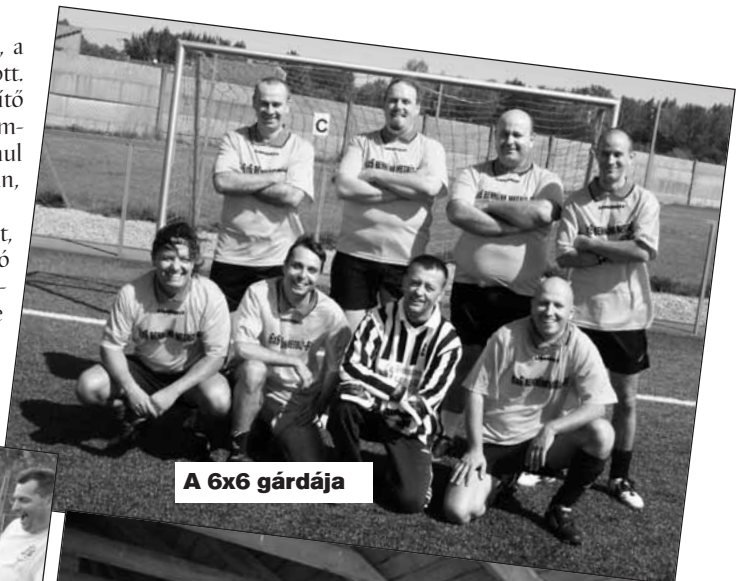
A 6x6 gárdája