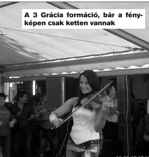
A 3 Grácia formáció, bár a fényképen csak ketten vannak

csocsó, pingpong, kézműves foglalkozás, néptánc tanulás, meg minden. No de látom, mellébeszéltek, mivel a másik főszereplő, az ebéd következne mostan! Hát kérem, volt itt minden. Kezdtük egy kis gyenge bográcsgulyással (táposoknak gyümölcsleves). Aztán laza válogatás: pincepörkölt bográcsban, csülkös-kolbászos lebbencs, rablólús burgonyával, zöldséggel, töltött csirkemell-comb, zsiványpecsenye, hagymás burgonya, tejfőlés túrós csusza. Mi kell még ehhez? Saláták, zöldségek, öntetek. Desszertnek vaníliás mákosguba, tejes pite házi szilvalekvárral. Már aki még eddig eljutott. És persze sörök, alföldi vörös és fehér borok,