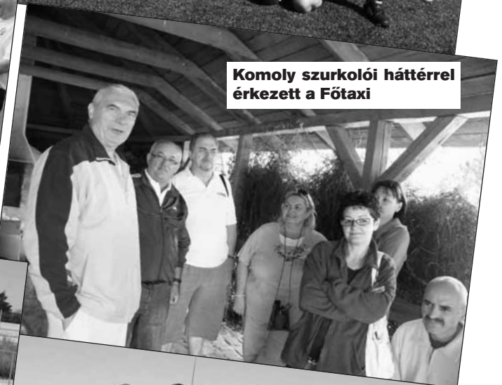
Komoly szurkolói háttérrel érkezett a Főtaxi