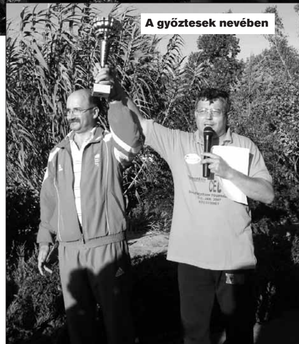
A győztesek nevében