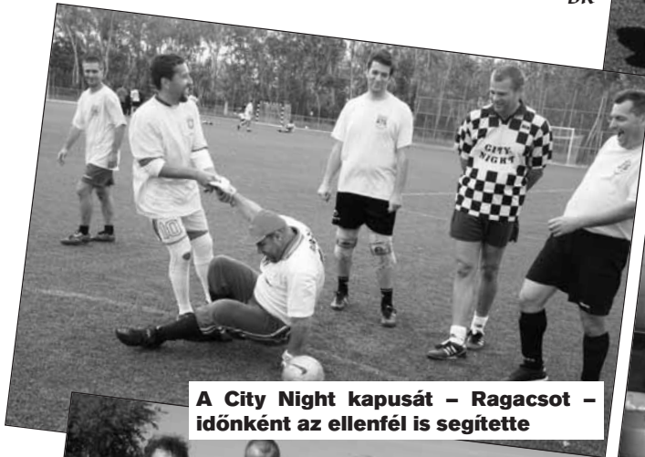
A City Night kapusát – Ragacsot – időnként az ellenfél is segítette