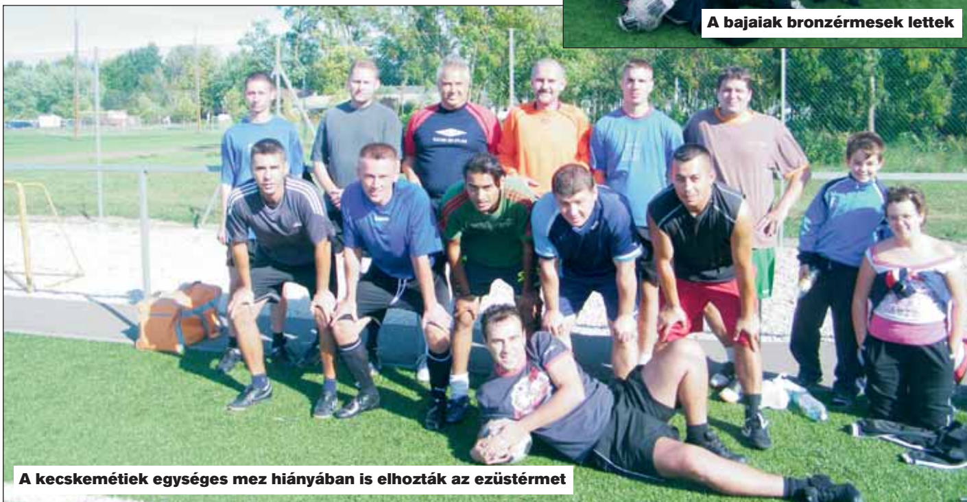
A kecskeméti egység mez hiányában is elhozták az ezüstérmét