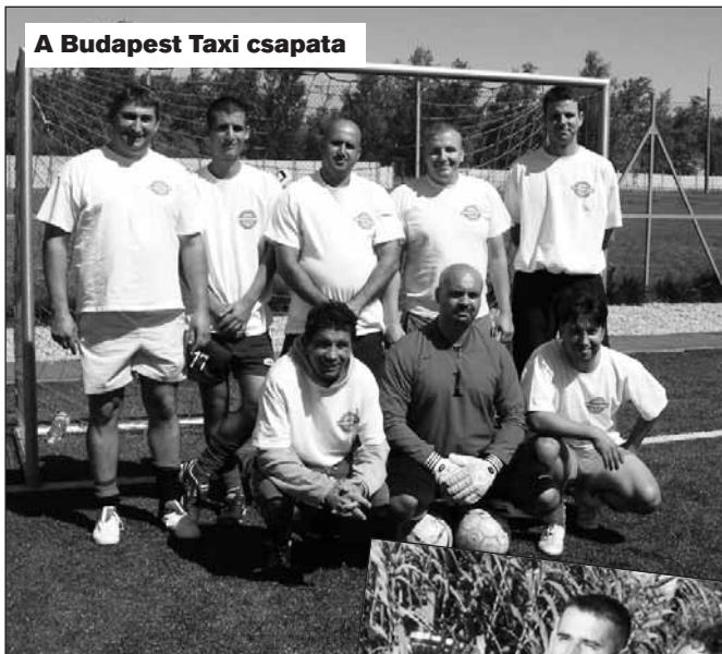
A Budapest Taxi csapata