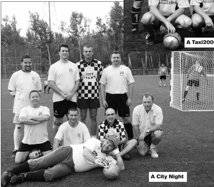
A City Night

Az évente különböző helyszíneken megrendezésre kerülő esemény immár az ország legnagyobb taxis focitornájává nőtte ki magát. Szeptember első hétvégéjén 14 csapat nevezett a versenyre az ország minden részéből. Itt voltak az előző év helyezettjei, bajnokai, de érkeztek új közösségek is a megméretetésre. Tekintettel a csapatok számára, három műfüves pályán, három csoportban kezdődtek a selejtezők. A körmérkőzések a következő sorrendet eredményezték: