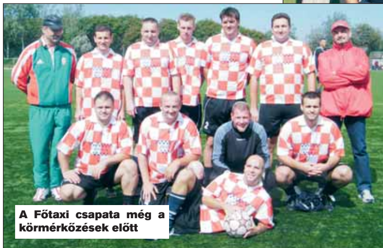
A Fótaxi csapata még a körmérkőzések előtt