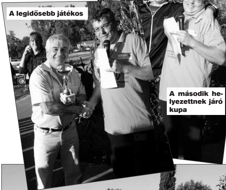
A legidősebb játékos