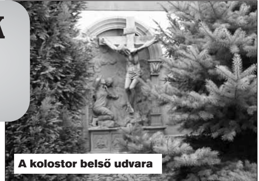
A kolostor belső udvara