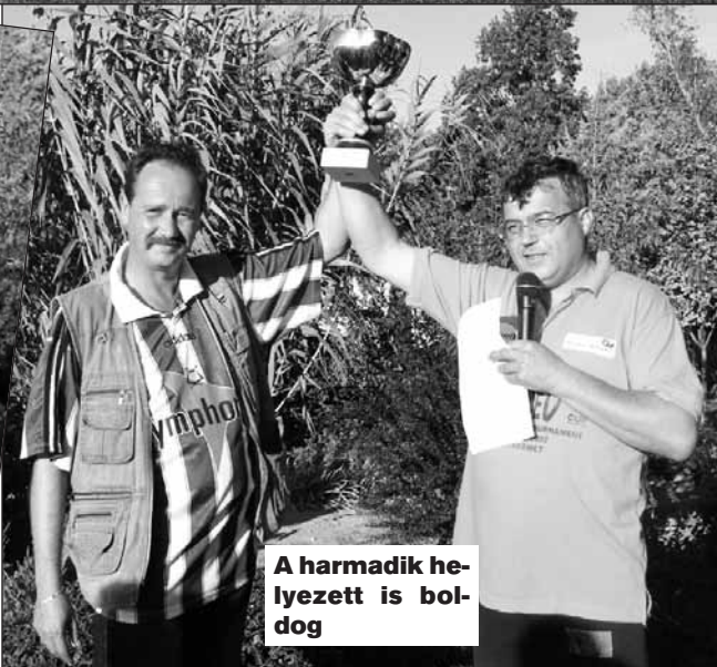
A harmadik helyezett is boldog