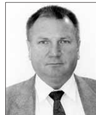
A Lámpafelelős Főtaxi URH 558